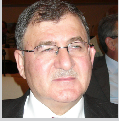
بغداد / الصدا

على توكينات الجبس التي تذبذب بتأثير خزن المياه في البحيرة.