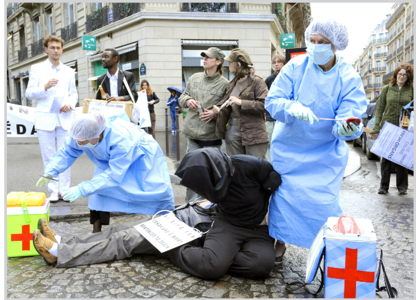
اعضاء من الجمعية الفرنسية يتظاهرون ضد عقوبة الاعدام