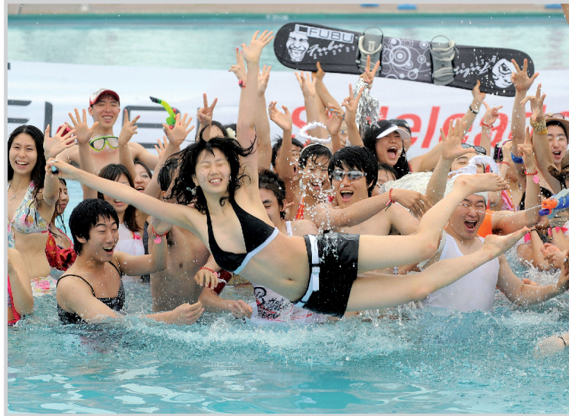
طلاب من الجامعة الكورية الجنوبية يسبحون في أثناء مسابقة الأزياء لهواة