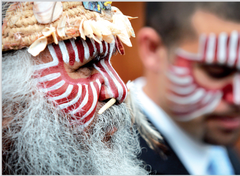
الرائد البريطاني سومنر من قبيلة نكارنجيري في مراسم التدفئة بجامعة أدنبره