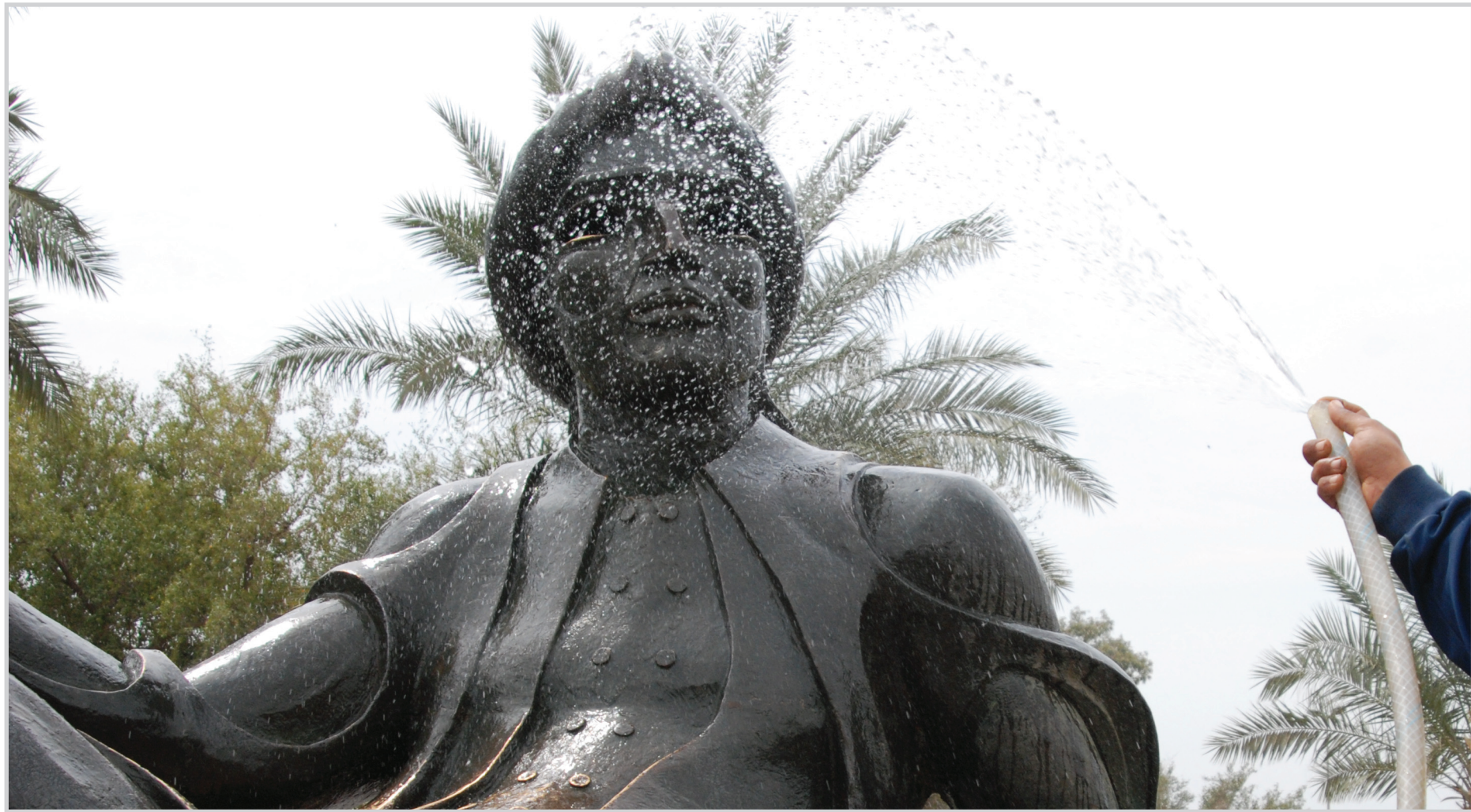
أدلة التصب في بغداد

البصرة نفذت دائرة العمل والتدريب المهني دورات متنوعة في محافظة البصرة تضمنت برامج عن الدفاع المدني وإطفاء الحرائق والإسعافات الأولية وأرصادات بخصوص التعامل مع المتفجرات .