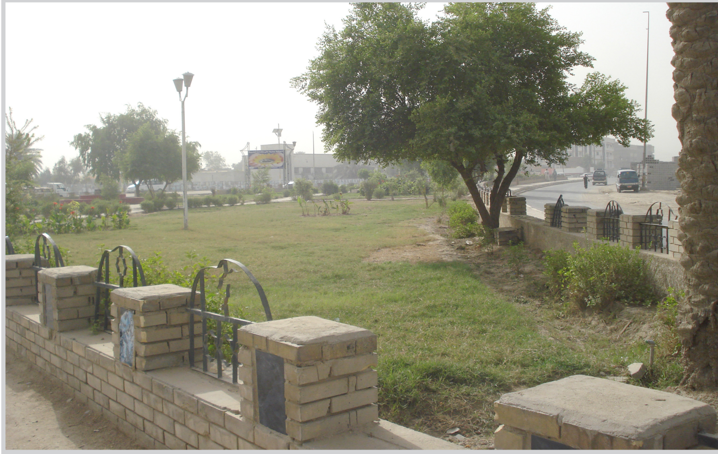
ما يستحق الأشادة..

أعرب مواطنون من سكنة البلديات عن أملهم، بأن يقوم المجلس البلدي، والأمانة بأعمال أكبر وأوسع في المنطقة، لاسيما ان فصل الشتاء على الأبواب، والمنطقة فيها أحياء منخفضة تملئ بالياه عند سقوط الأمطار ما يؤدي الى عرقلة الحياة فيها، معبرين عن شكرهم لما تقوم به الأمانة من حملات لأكساء شارع البلديات الرئيس، وشارع المصرف، وحملة الأمانة لتقوية مياه الشرب.