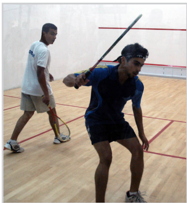
جانب من منافسات بطولة الاندية