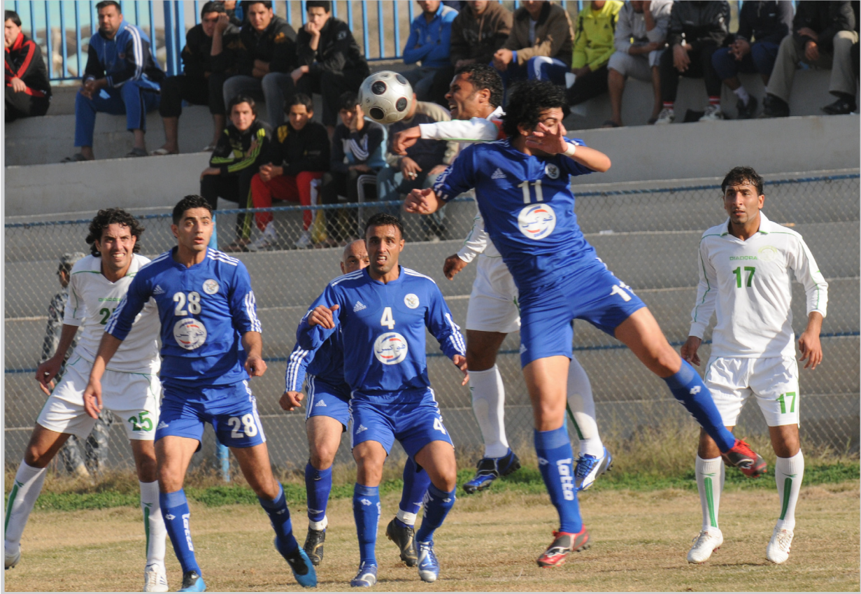
الجوية يتطلع لنقاط جولته السهلة مع الرمادي