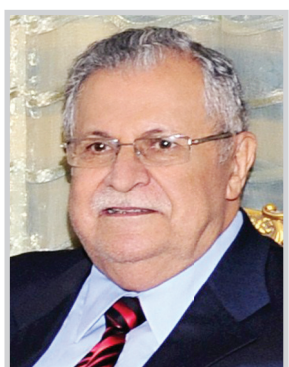
رئيس الجمهورية جلال طالباني

الجلال الذي منيت به بلانكم بمصرع رئيس الجمهورية ليخ كازينسكي في حادث مروع كان من بين ضحاياه عقيلة الرئيس وعدد من كبار المسؤولين في بلادكم، مضيفاً ان مصرع الرئيس كازينسكي ورفاقه في هذه الفاجعة المؤلمة خسارة فادحة لبلانكم التي فقدت رئيسها وشخصيات لامعة اخرى عملوا كلهم بدأب على خدمة بلدهم.