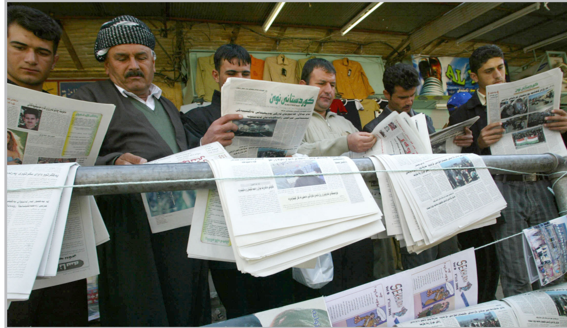
زيادة الأقبال على الصحف

التعبير تؤمن بدور الإعلام في الحقول السياسية والإدارية. كما ان بإمكانه ان يكون مراقباً مهماً لتطبيق الشفافية والصدق في إيصال المعلومات للمواطنين وهذا يفرض علينا رؤية ومسؤولية مشتركتين في إيجاد الحلول للمشاكل.