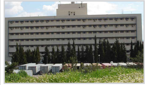
أحد مستشفيات الإقليم