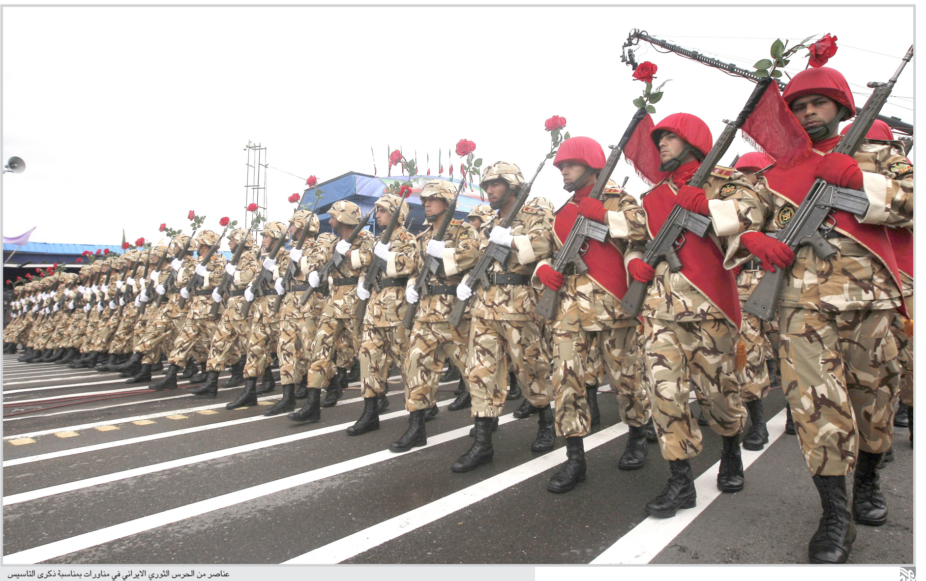
عناصر من الحرس الثوري الإيراني في مناورات بمناسبة ذكرى التأسيس

تندون/وكالات: اصطدم المرشحون الرئيسيون الثلاثة للانتخابات العامة البريطانية في المناظرة التلفزيونية الثانية حول القضايا الخارجية. المناظرة جرت بين كل من جوردون براون رئيس الحكومة ومرشح حزب العمال، وديفيد كاميرون زعيم حزب المحافظين المعارض ونيك كليغ رئيس حزب الديمقراطيين الإحرار الذي اتفق المراقبون على أنه كان قد خرج الفائز الأكبر من المناظرة الأولى التي جرت الأسبوع الماضي. كاميرون براون يتخوف المواطنين وتفادي كل من براون وكاميرون «الموافقة» على ما يقوله كليغ كما فعلا في المناظرة الأولى وركز كل من الزعماء الثلاثة على الاختلافات بين سياسة كل منهم. وهذه المناظرة التي كان فيها أداء الجميع جيدا أظهرت فعلا ان المرشحين الثلاثة يخوضون فعلا سباقا محموما. ومباشرة بعد انتهاء المناظرة بدأت تصد نتائج استطلاعات رأي اولية واعطت صحيفة الصن اللندنية القريبة من حزب المحافظين ديفيد كاميرون فوزا بـ 36 بالمئة من تأييد المشاهدين مقابل 32 بالمئة لكليغ و 29 بالمئة لبراون. اما مؤسسة «يوغوف» للاستطلاعات فقد قالت ان براون حسن اداءه بنسبة 10 بالمئة وكاميرون بنسبة 7 بالمئة اما كليغ فقد انحدرت نسبة تأييده 19 بالمئة مقارنة بما كانت عليه الأسبوع الماضي. وابتدت المناظرة أكثر حيوية من تلك التي جرت الأسبوع الماضي وبخاصة