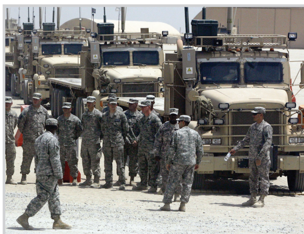
القوات الأمريكية بإخلاء المعسكر سبار الموجودة في محافظة ذي قار إلى الحكومة العراقية، بعد ان قامت

لا مرشح بديل نفي النائب عن ائتلاف دولة القانون حيدر العبادي الإنشاء التي تفيد بان ائتلافه في طور بحث عن مرشح بديل عن مرشحه نوري المالكي وقال العبادي إننا "لم نناقش هكذا أمر لا داخل حزب الدعوة ولا حتى في كتلة ائتلاف دولة القانون ونحن أعلننا موقفنا بهذا الخصوص في البيان الذي صدر عن دولة القانون وأوضحنا فيه اصرارنا وتمسكنا بترشيح المالكي". وأضاف ان "تمسكنا بترشيح المالكي ليس من باب شخصي او إننا لا نملك شخصيات أخرى بل هناك ارادة وطنية وشعبية تطالب بان يكون المالكي رئيسا للحكومة في المرحلة المقبلة. (واع)