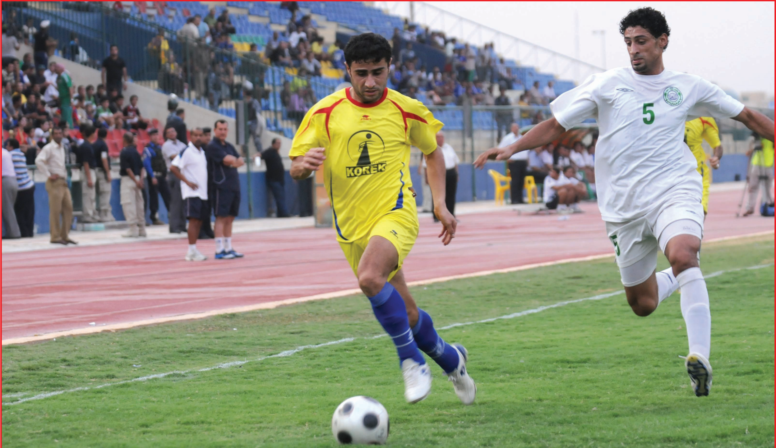
مواجهة صعبة لنادي دهوك امام النصر الكويتي

القادمة ، فضلاً عن تسميته مدرباً للمنتخب الاولمبي الذي يستعد للمشاركة في المرحلة الثانية من التصفيات الآسيوية المؤهلة لأولمبياد لندن ٢٠١٢ التي ستقام في نهاية شهر حزيران المقبل وكذلك مناقشة مناقشات دوري النخبة والمنتاز والدرجة الأولى .