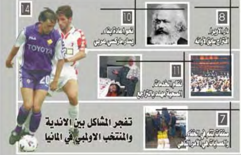
تفجر المشاكل بين الاندية والمنتخب الاولمبي في المانيا