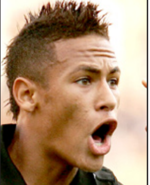
نيمار دا سيلفا

■ تعرض نجم كرة القدم البرازيلي نيمار دا سيلفا مهاجم فريق سانتوس لموقف غريب بعدما فشل في اللحاق بالطائرة ليتأخر عن الانضمام لمعسكر منتخب بلاده في مدينة جويانيا استعداداً للمباراة المرتقبة مع نظيره الأرجنتيني في سوبر كلاسيكو أمريكا الجنوبية اليوم الأربعاء ، وبلغت المنتخبين نهائياً في جويانيا بينما تقام مباراة الإياب في الأرجنتين في الثالث من تشرين الأول المقبل. ويعتمد كل من المنتخبين البرازيلي والأرجنتيني في هاتين المباراتين على اللاعبين الناشطين في الدوري المحلي بكل من البلدين من دون استدعاء أي من المحترفين بالأندية الأوروبية مما يعني غياب ليونيل ميسي نجم هجوم برشلونة عن صفوف المنتخب الأرجنتيني في هاتين المباراتين.