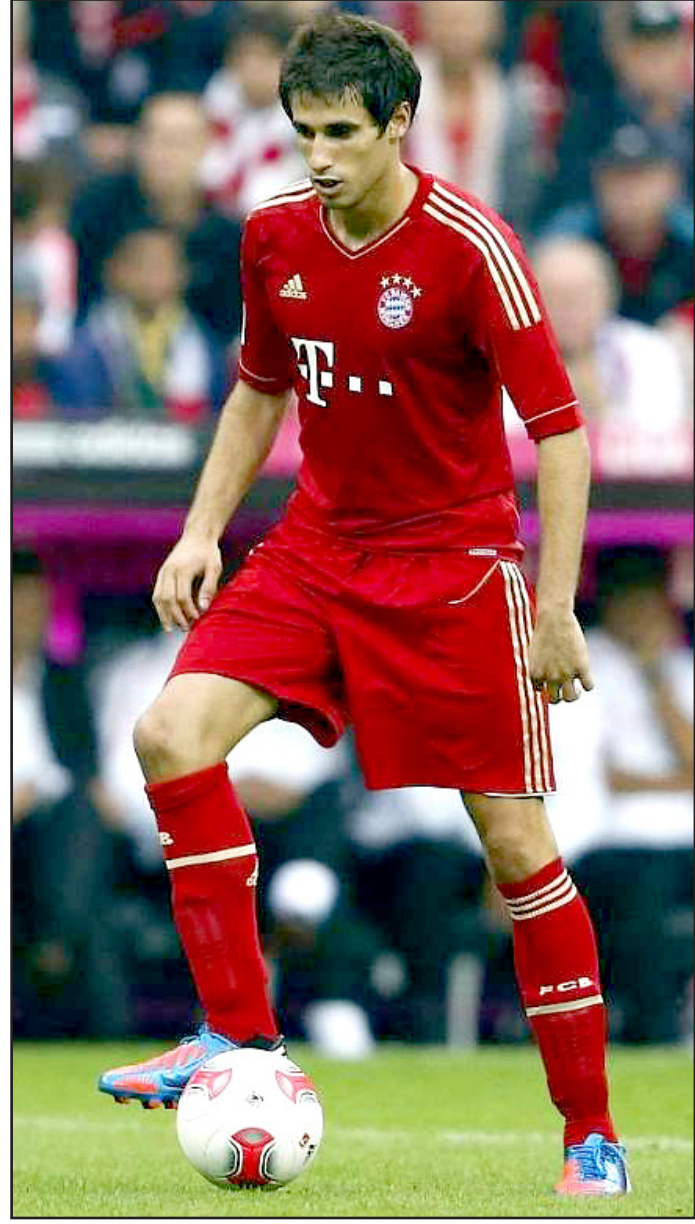
مارتينيز يتوسط مقالته بمستقبله مع البايرن

بالنسبة للسكن وجدت منزلاً يمكن لي الإقامة بهما الأول في وسط مدينة ميونخ والأخر في إحدى ضواحي المدينة واعتقد أن مميزات المنزل الأول تبدو جيدة لأنني ساكن قريباً جداً من المجتمع وبساعتني ذلك في تطور لغتي الألمانية وكذلك ساكن قريباً جداً من معالم الثقافة والحضارة الألمانية وأما مميزات المنزل الثاني فتكمن في أنني سأحظى بفترة هدوء طويلة ومناخية ولذلك اعتقد أن المنزل الذي يقع في وسط مدينة ميونخ سيكون الأفضل لي في هذه الفترة على الأقل.