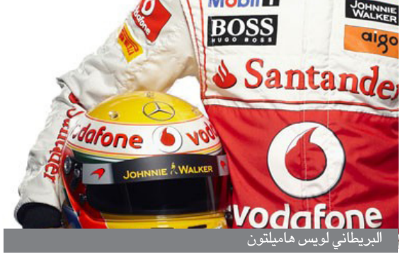
البريطاني لويس هاميلتون

يذكر أن وكلاء هاميلتون يحاولون منذ أشهر عدة التفاوض مع ماكلارين حول عقد جديد لخمس سنوات يدر عليه ١٠٠ مليون يورو على الأقل. ويُعد هاميلتون أحد المرشحين الأوفر حظاً لإحراز المركز الأول في جائزة سنغافورة الكبرى، المرحلة الرابعة عشرة من بطولة العالم، الأحد المقبل.