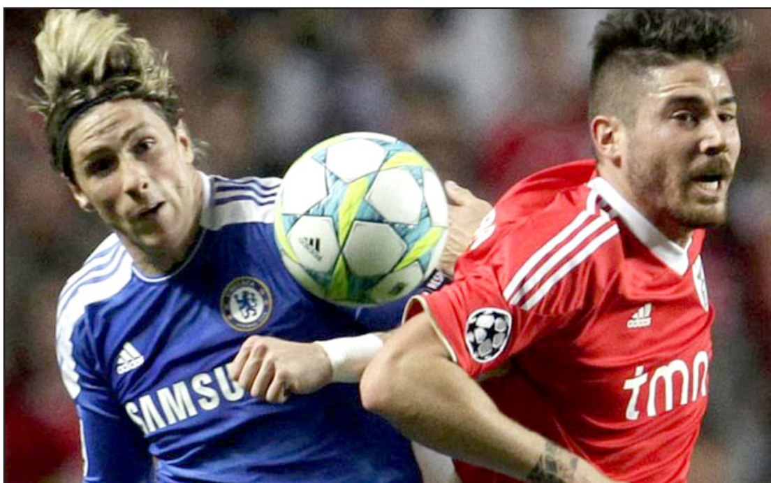
اليوفي والبلون في قمة ساخنة على ملعب بريدج

واستأنف اللاعبان التدريبات مع الفريق بعدما أبعدتهما الإصابات العضلية عن مباراة الفريق التي حقق فيها الفوز ٣-٢ على ماينز في الدوري الألماني (يونسليفا)، وبذلك يستطيع هاينكس الاعتماد في مباراة فالنسيا على جميع لاعبيه باستثناء ماريو غوميز هداف الفريق الذي لا يزال يُعاني من الإصابة، ويعود ريبيري إلى مكانه في تشكيلة الفريق بدلا من السويسري خيردان شاكيري.