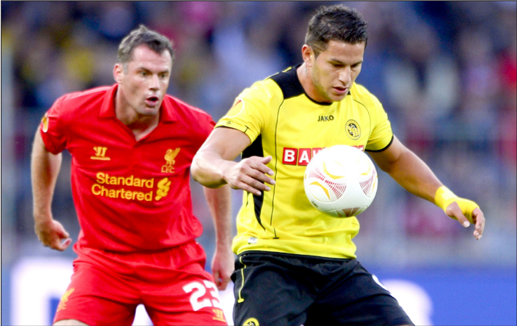
لغبربول يلن بوز درسا قاسيا

وللخاسر هدف ولسون ادواردو في الدقيقة ١٩. واكتسح بوردو الفرنسي منافسه كلوب بروج البلجيكي (٤-٠)، سجلها السنغالي لودوفيك ساني في الدقيقة ١٣ ويوان غوفران في الدقيقة ٢٧ وبيورن انكلز في الدقيقة ٤٧ خطأ في رمى فريقه، والبرازيلي جوسي في الدقيقة ٦٦. وفي ظل غياب المهاجمين السنغاليين دمبا لانقاده خيارات المدرب ألن بارنو وبابيس سيسيه المريض، عاد