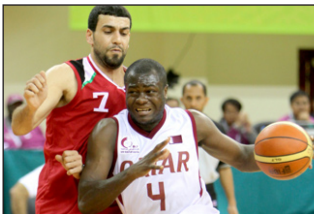
لبنان تحضن السلوية الآسيوية

وقد تم اتخاذ القرار من قبل اللجنة التنفيذية عن طريق التصويت، بعد النظر في الملفات الثلاثة التي كانت مقدمة من كل من الفلبين وإيران