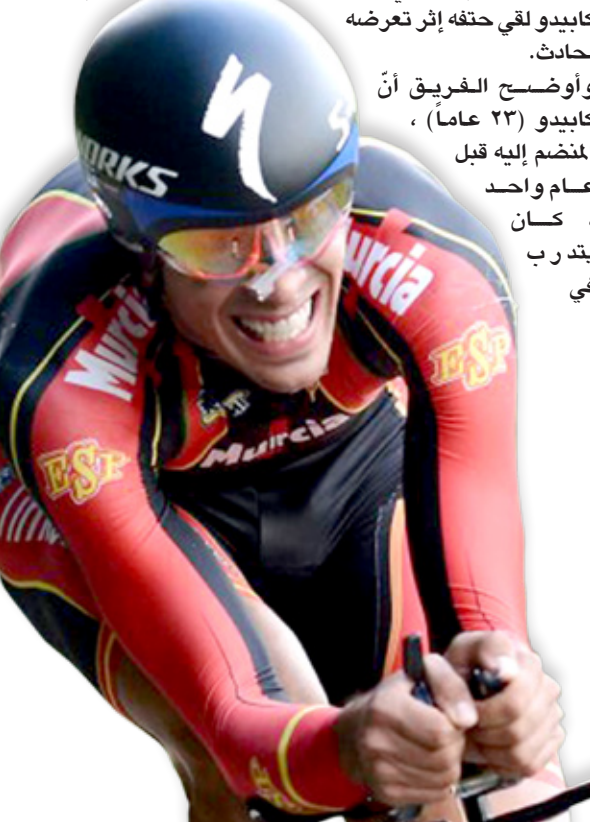
الدراج الإسباني فيكتور كابيدو

طريق ثم تعرّض للاصطدام بسيارة ليلقي حثفه. ووقع الحادث على بعد كيلومترات قليلة من مدينة أوسدا الإسبانية.