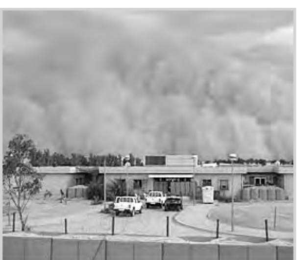
تصوير لمرافق محطة توليد الكهرباء في الموصل.

بغداد / صند الليليا من المعلوم أن سقوط المطر يبعث البهجة والسرور في قلوب الناس برغم الخشية من طغح المجاري وغرق الشوارع والبيوت، وبالمقابل فإن سقوط الغبار، وبمثل الكثافة التي مرت بنا خلال الأسبوع الماضي يبعث على القلق لما يسببه من تغيرات في الطقس وإتلاف للمزروعات إضافة إلى ارتفاع الحالات المرضية من الحساسية والربو علاوة على تعكير المياه. فما قصة الغبار؟ وما أسبابه؟ ومن أي الجهات تقدم نحو العراق؟ للإجابة عن تلك الأسئلة وغيرها، اخترقنا حاجز الغبار عبر هذه المتابعة التي لا تخلو من معلومات علمية مفيدة ومفارقات طريفة..