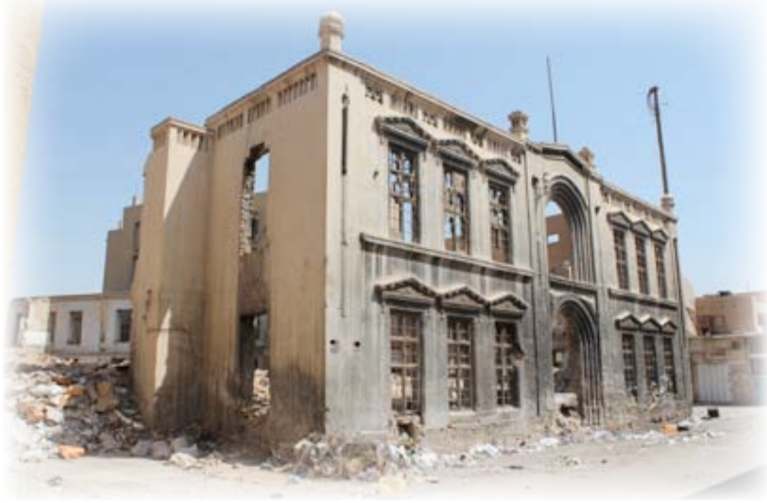
بنية كتاب العدول (متصرفية لواء بغداد سابقاً)

تعبير عنها حالة مغادرة عوالم مائية أو سفلية بروافد ومتفرعات وتشققات شتى وداخلية دائماً في انكساراتها الذاتية وتكسراتها، أي عوالم علوية بتكوينات ملحقلة نزاعاً للنسائي وغير مبالية حتى باختلاجاتها الأقرب... من غير فتوثيق تجربته أو معرفة عناصرها ليس هما بذاته لدى هذا الفنان العراقي اللاهج بعنق الأهور والجبائش والحياة.