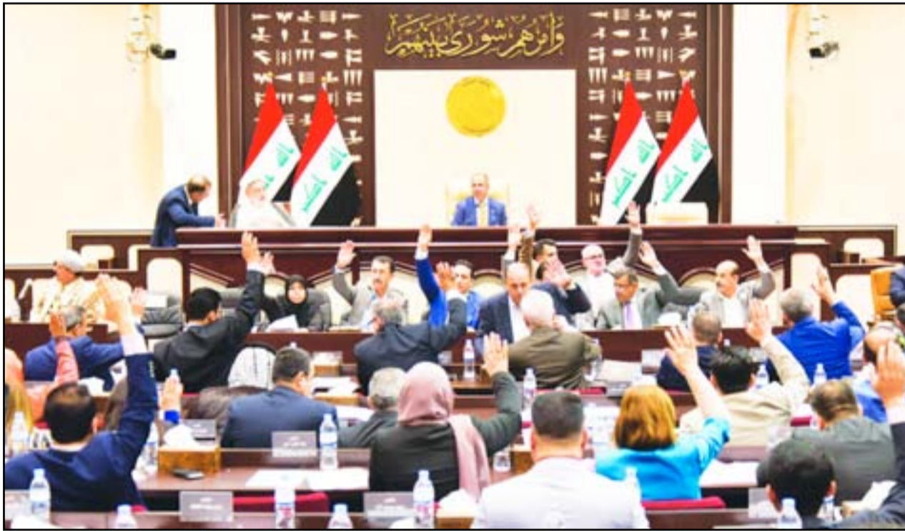
جلسة سابقة لمجلس النواب

أكدوا أنّ الأدلة ستجبر المفوضية على إلغاء مراكز ومحطات انتخابية