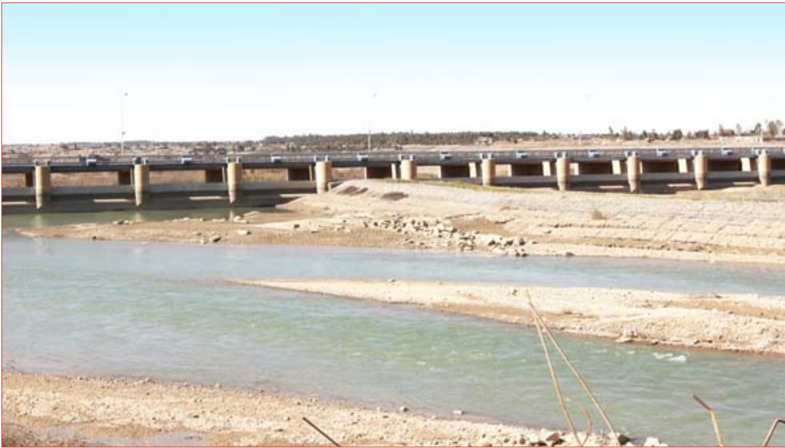
انخفاض المياه في سد الصدور الواقع في ديالى ..... عسدة: محمود رؤوف

وقال المكتب الإعلامي للعبادي، في بيان تلقت (المدى) نسخة منه، إن الأخير ترأس اجتماعاً للمجلس الوزاري للأمن الوطني، وخصص الاجتماع لمناقشة ظاهرة شح المياه في العراق. وأضاف إن المجلس استمع إلى إيجاز عرضه وزير الموارد المائية