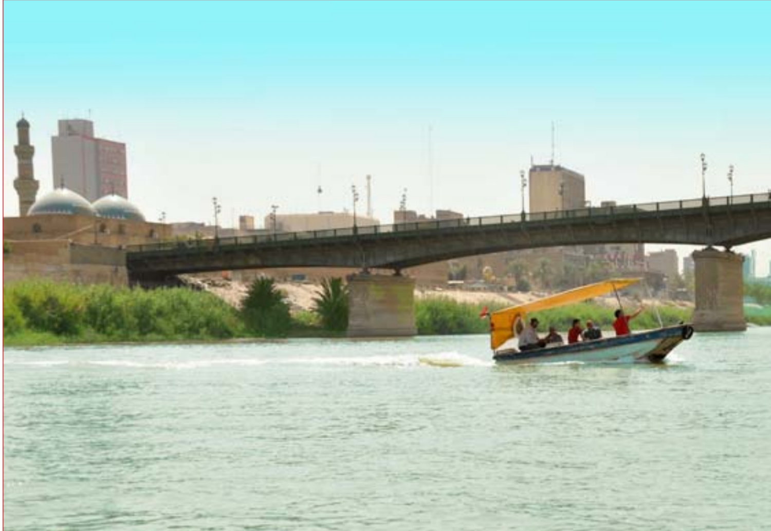
الحر يدفع أهالي بغداد للتفسيح في سجلة ..... عسدة: محمود رؤوف

بغداد/ وائل نعمة المجلس المفوضية الجديد (القضاة المنتخبون) أوراقيه وغادر كركوك في وقت متأخر من مساء السبت متجهاً إلى السلطانية، بعدما انتهى عصر اليوم نفسه من عمليات العد والفرز البيدي في المحافظة من دون إعلان النتائج. وكان من المتوقع أن تنتهي عملية تدقيق أكثر من ٥٠٠ صندوق نهاية يوم أمس الأحد.