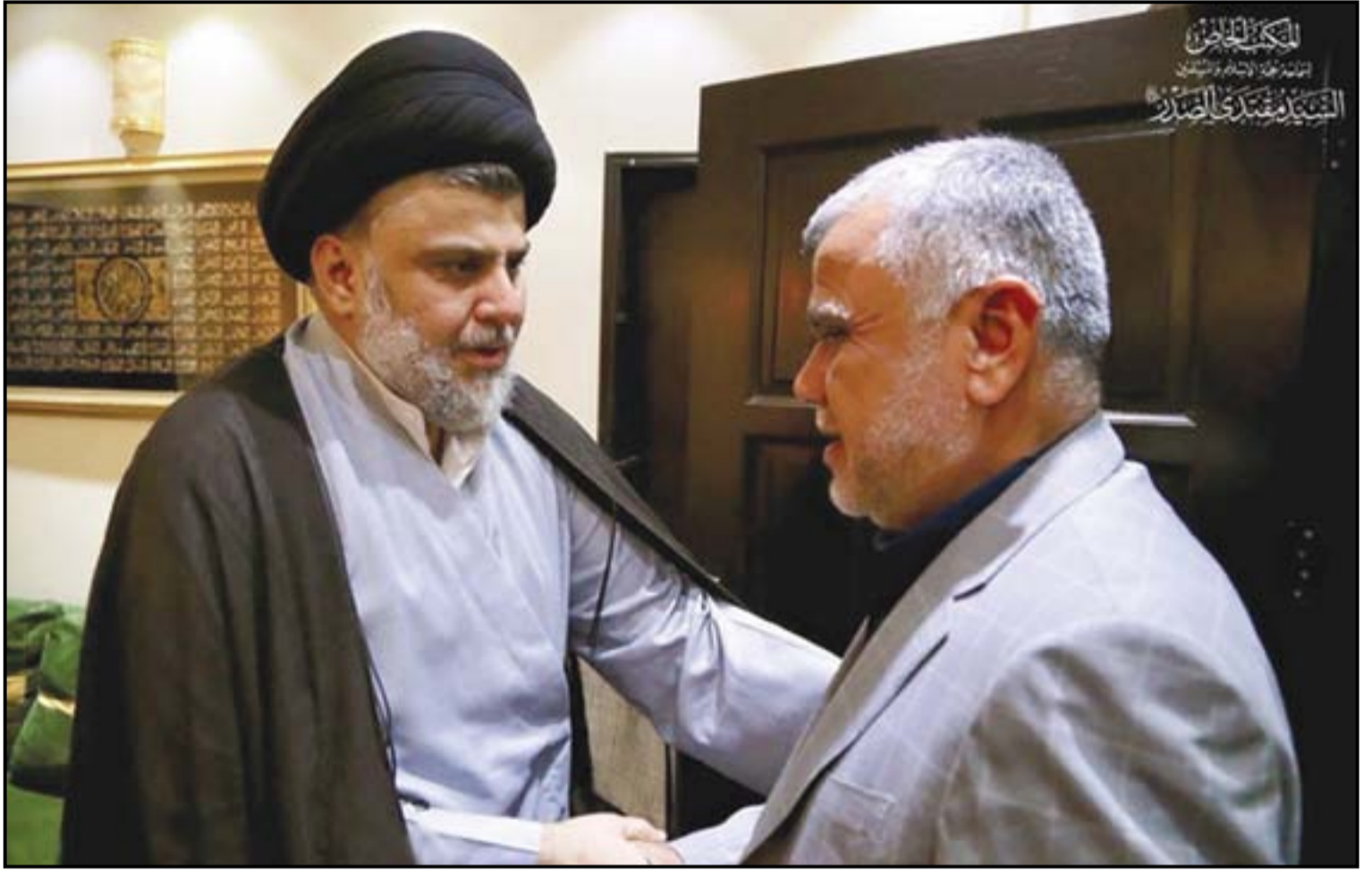
الصدر والعامري خلال لقائهما الأخير .. ارضيف

ويشير المصدر المطلع إلى تفاصيل المفاوضات الى أن "موضوع إدارة محافظة كركوك بطريقة مشتركة بين البيشمركة والجيش الاتحادي يعدّ من أكثر النقاط خلافية مع القوى الكردستانية"، مبيّنا أن "مشكلة القوى السنية أنها منتشقة في مواقفها وفي ترشيح الأسماء بسبب تعدد القوائم واختلاف المواقف".