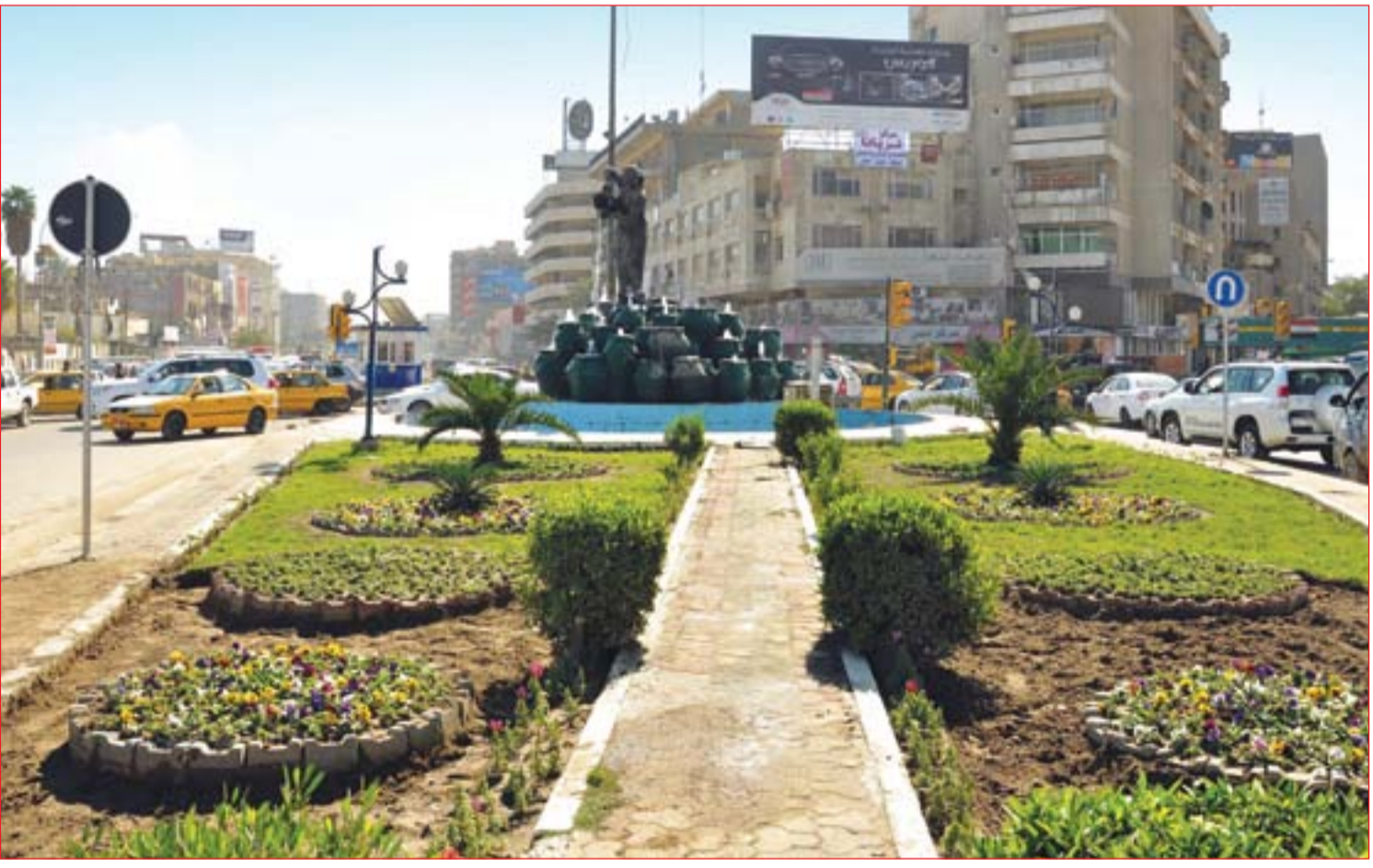
لقطة عامة لساحة كهرمانة ..... عسة: محمود رؤوف

أعدت جهات حكومية ورقابية في النجف، أنها لا تعلم حجم المبالغ التي سرقتها شخصيات في مجلس إدارة مطار المحافظة خلال المدة الماضية.