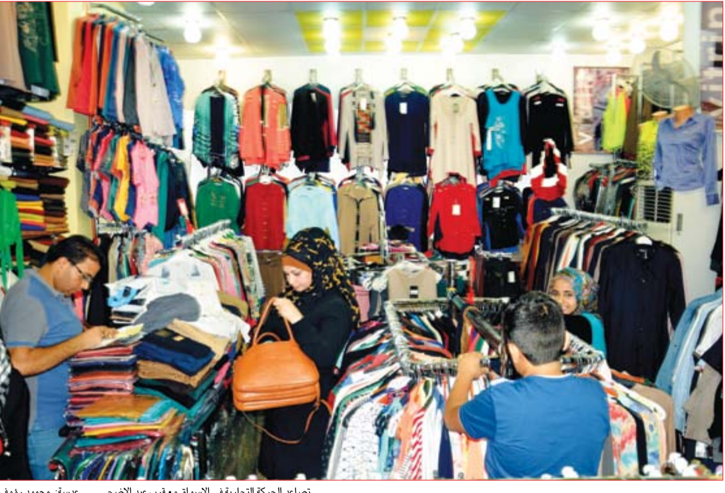
تصاعد الحركة التجارية في الاسواق مع قرب عيد الاضحى.....

قد يتقلص اعتماداً على موعد إرسال قوات أخرى من حلف الناتو للعراق للمساعدة في تدريب الجيش العراقي، مشيراً الى تواجد ما يقارب 5,200 جندي أميركي حالياً في العراق. وكان وزراء دفاع حلف الناتو قد اتفقوا في شباط على مهمة أكبر للتدريب والمشورة في العراق وذلك بعد دعوة تقدمت بها الولايات المتحدة للحلف للمساعدة في جهود إعادة الاستقرار للبلاد بعد ثلاث سنوات من الحرب ضد داعش. وأضاف الكولونيل رايمان قائلاً "من المحتمل أن يكون هناك تقليص بعدد القوات ولكن ذلك يعتمد فقط على موعد مجيء فريق حلف الناتو في العراق ليساعدوا في تدريب القوات كذلك". وكان العراق قد أعلن رسمياً النصر على مسلحي تنظيم داعش في كانون الاول وذلك بعد خمسة أشهر من السيطرة على الموصل.