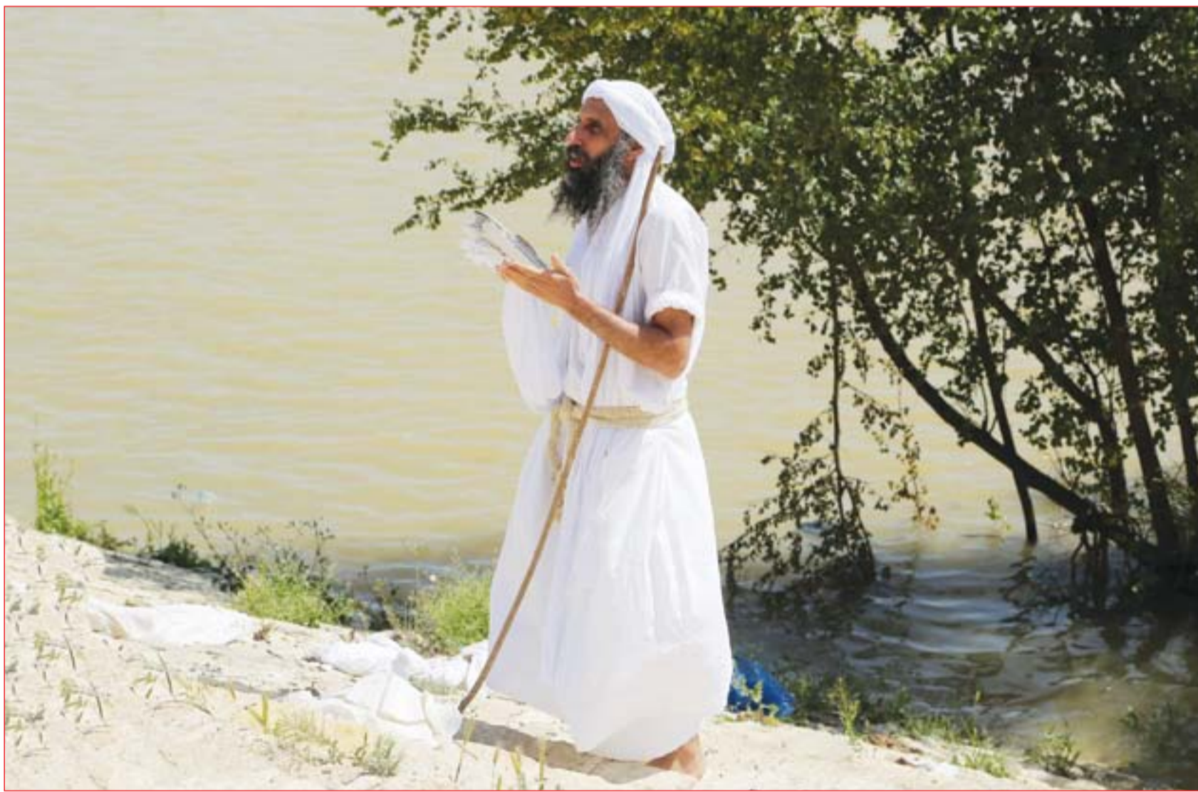
الصابية يحتفلون بعيد الخليفة على ضفاف دجلة.....