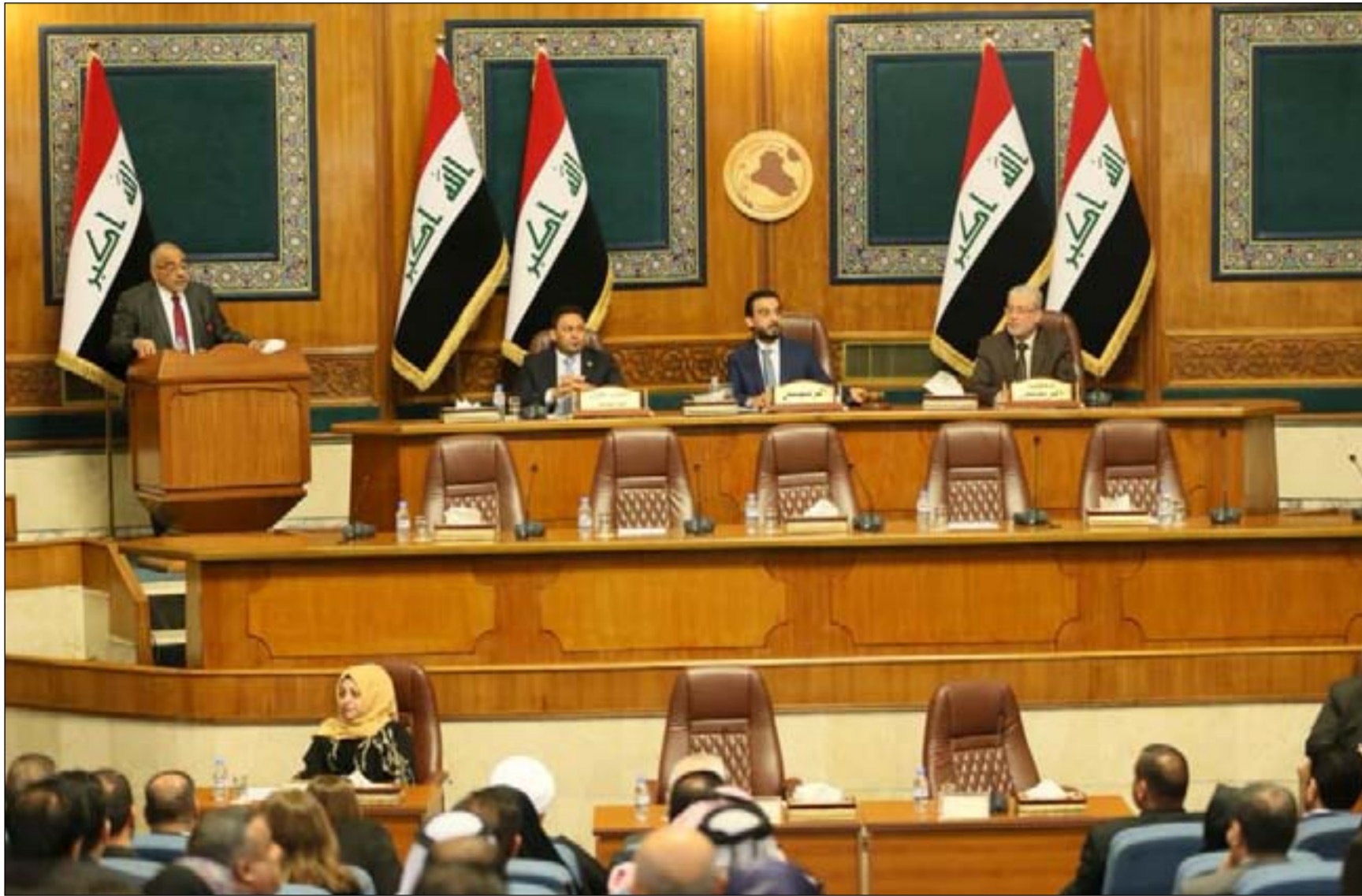
بغداد / محمد صباح

يدرس مجلس النواب مقترح قانون قدمته الحكومة يقضي بتعديل قانون الجنسية العراقية بطريقة تسمح بتجنيس أكثر من خمسة آلاف طفل يعودون لمسلحين من داعش ولدوا على الأراضي العراقية.