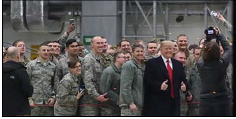
جنود اميركان والرئيس الاميركي في قاعدة عين الاسد.. ارشيف

لدى الولايات المتحدة الاميركية حالياً في العراق اكثر من ٥٠٠٠ جندي وذلك وفقاً لاتفاقية بين البلدين. وكانت الولايات المتحدة قد سحبت قواتها من العراق عام ٢٠١١ عند انتهاء مهامها القتالية هناك، ثم المابحث ان رجعت مرة اخرى بعد ان بدأ تنظيم داعش باجتياح مساحات واسعة من البلاد خلال العام ٢٠١٤.