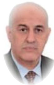
القاضي سالم روضان الموسوي

قانون الانتخابات والاستفتاء الشعبي السيد رئيس الجمهورية المحترم إنك رئيس الدولة واعتبرك الدستور رمز وحدة الوطن ومكلف بالسهر على ضمان الالتزام بالدستور والمحافظة على استقلال العراق وسيادته، ووحده، وسلامة أراضيه، وفقاً لأحكام الدستور وهذا ما نصت عليه المادة (67) من الدستور كما إنك وعند توليك المنصب أقسمت بالله العلي العظيم بأن تسهر على سلامة نظام العراق الديمقراطي الاتحادي، وعلى وفق القسم الوارد في المادة (50) ببلالة المادة (71) من الدستور، وهذه المهمة الجسيمة لا بد من تحمل عناء الالتزام بتنفيذها لأنك تحت القسم وذلك عبر الآليات الدستورية والقانونية، ومنها أن يكون الالتزام بالدستور هو الهاجس الأول والأخير والهدف الأسمى، لأن من أهم المبادئ الدستورية التي وردت في الدستور النافذ أن يكون النظام السياسي في العراق جمهوري نيابي ديمقراطي، على وفق ما جاء في ديباجة الدستور والمادة (1) منه، وحيث إن مجلس النواب هو حجر الزاوية في تشكيل وتكوين الدولة لأن من عباءته يخرج رئيس الجمهورية ورئيس الوزراء والحكومة وسائر المناصب الفصليية في الدولة وتحت كنفه تكون الرقابة والمحاسبة، لذلك فإن الدستور الذي حظي بقبول الشعب عند الاستفتاء عليه قد أكد على أن مجلس