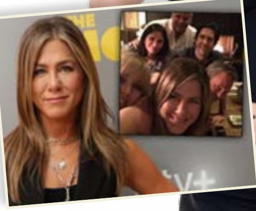
حققت الممثلة الأمريكية جينيفر أنيستون أكثر من مليون متابع على حسابها الرسمي في "إنستغرام" بعد ساعات قليلة فقط

من انضمامها إلى هذه الشبكة الاجتماعية. وتمكنت الممثلة البالغة من العمر ٥٠ عاماً، من تحطيم الرقم القياسي العالمي كونه حسابها الأسرع على الإطلاق في جمع مليون متابع على "إنستغرام"، في وقت لم يتجاوز ٥ ساعات و١٦ دقيقة، وفقاً لتقرير غينيس للأرقام القياسية هذا الأسبوع. وتخطت أنيستون كلا من الأمير هاري وميغان ماركل اللذين كسرا الرقم القياسي العالمي الأسرع في كسب مليون متابع على "إنستغرام" في نيسان الماضي، حيث حقق حسابها على الشبكة الاجتماعية