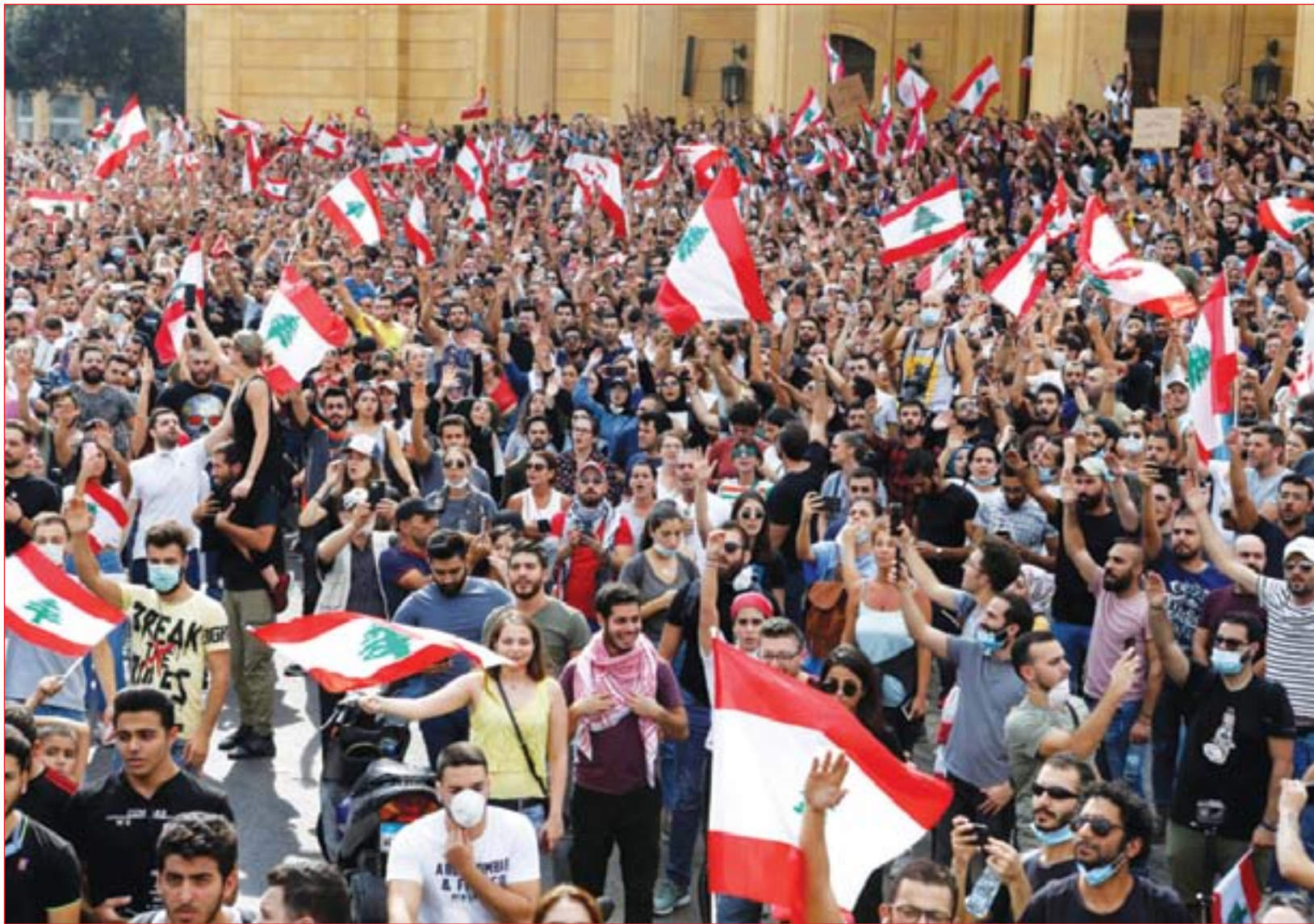
جانب من التظاهرات في لبنان المطالبة بتحسين العيشة والتي تستمر منذ أيام

النهار"، مبينة ان "درجات الحرارة العظمى في بغداد سجلت اليوم الاحد ٣٥ درجة مئوية". واضافت ان "الطقس سيكون في المنطقة الشمالية غائم جزئياً الى غائم مع تساقط امطار في بعض الاماكن خاصة في الاقسام الشرقية منها تكون رعدية احياناً، والتغير في درجات الحرارة". وأشارت الى ان "الطقس سيكون في المنطقة الجنوبية غائم جزئياً واحياناً غائم مع فرصة لتساقط زخات مطر خفيفة ومتفرقة".