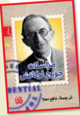
ترجمة: نافع معلا

ما يزال "جورج لوكاتش" المفكر والنقاد المجرى مرجعاً لكثير من المشتغلين بالأدب والنقد الأدبي، قلما نجد نصاً نقدياً، مهما كان منهج كاتبه، إلا ويُؤيِّنه برأي لجورج لوكاتش ليدعم صحّة تحليله واستنتاجه، كأنه يمنح أو يرقّي نفسه رتبة علمية. مهما يكن، فإن لوكاتش مفكر إشكالي، وفي هذا الكتاب الذي صدر مؤخراً عن "دار المدى" سنعرف الكثير من أسراره لأننا سنطلع على مراسلاته التي تكشف عن الجانب الذاتي والشخصي من حياته، سنقرأ رسائله - رسائل كما يقول المترجم "نافع معلا" كان جورج لوكاتش أودعها في بنك هايديلبرغ بألمانيا في ٧ تشرين الثاني ١٩١٧، واكتشفها (فريزريتر) فأعدها وأصدرها في كتاب.