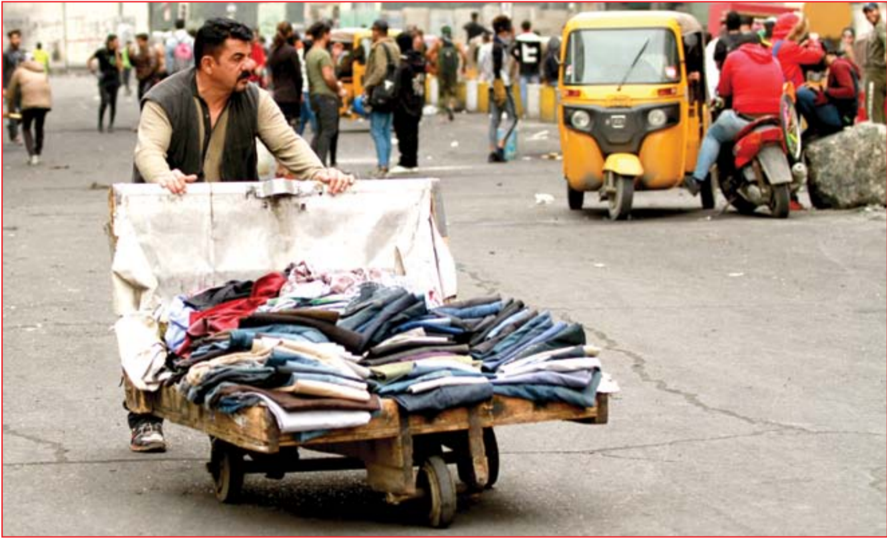
باعة جوالون في مناطق التظاهر ببغداد..

بالمقابل يجد فريق آخر، ان من الأسلم محافظة ساحات الاحتجاجات، على