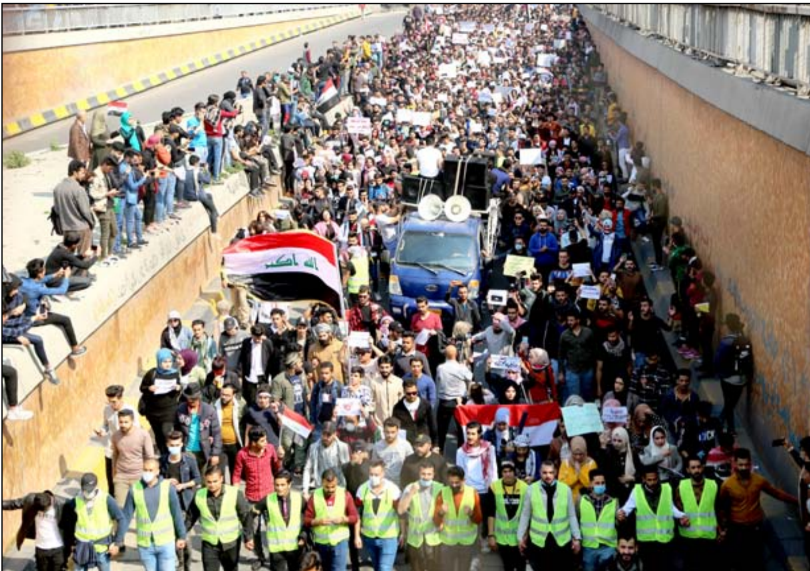
الطلبة خلال تظاهرات التحرير..

يرى قسم من المتظاهرين، ان كرة اختيار مرشح جديد لرئاسة الوزراء - بعد انسحاب محمد علاوي - عادت مرة اخرى الى ملعب الاحتجاجات، لكن عليها (الساحات) هذه المرة، ان تغيير من "تكتيك" اللعب، لتسد الطريق على القوى السياسية من استقدام مرشح جديد على قياسي السلطة.