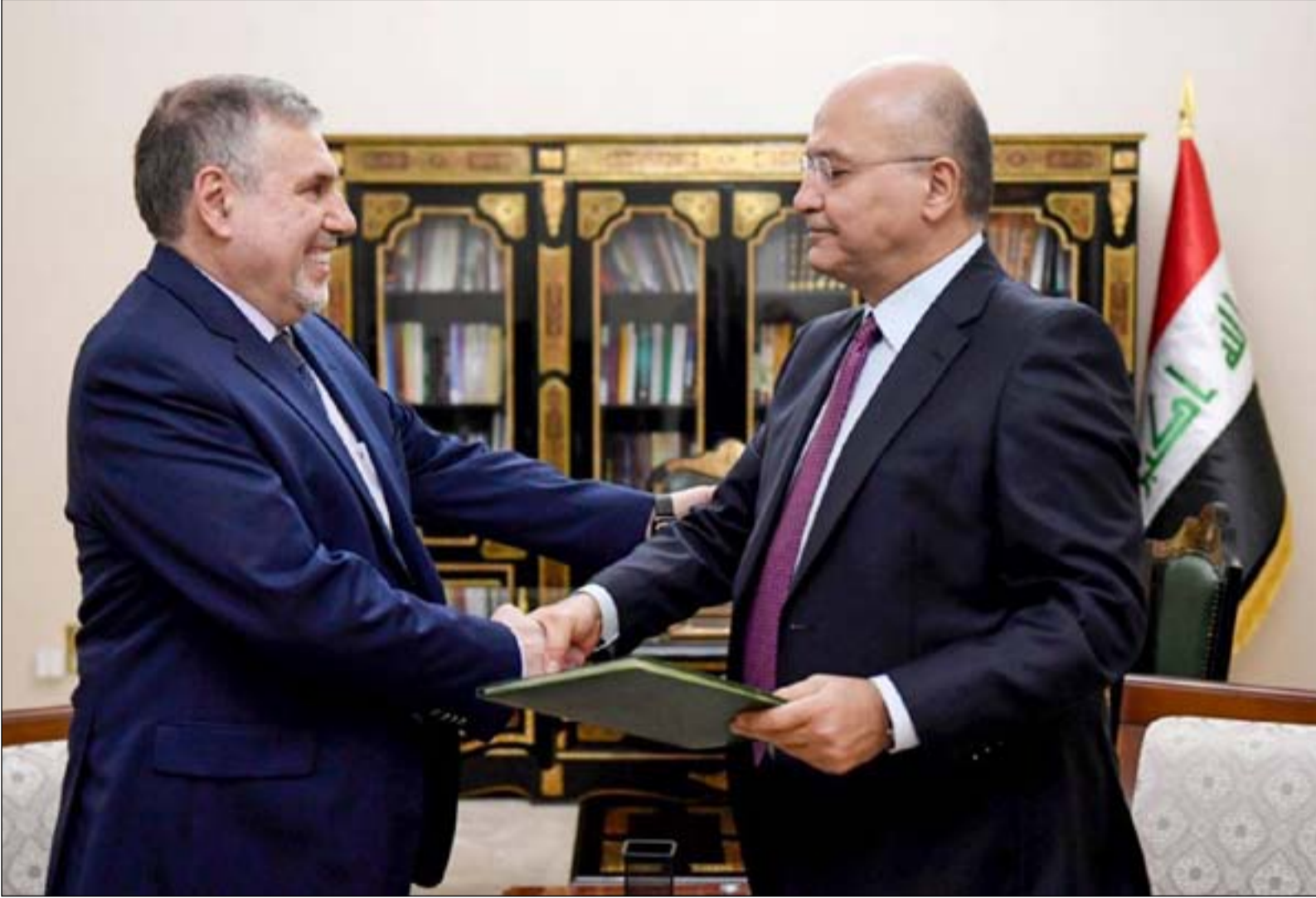
صالح وعلوي خلال التكليف... أرشيف

رئيس الجمهورية يدعو الكتل للاتفاق سريعاً على مرشح يحظى بقبول شعبي