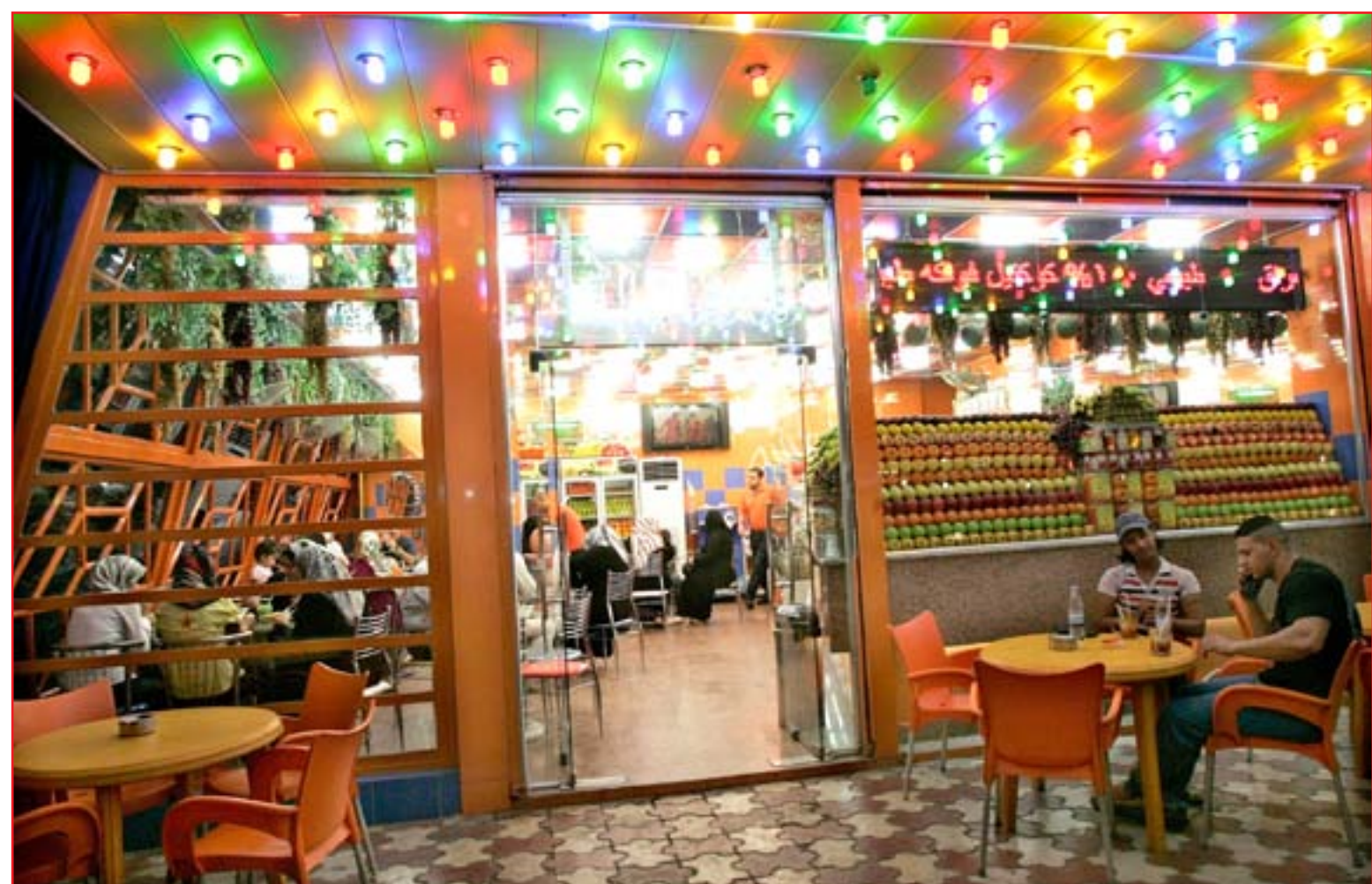
مقاهي بغداد تفتتح من جديد...