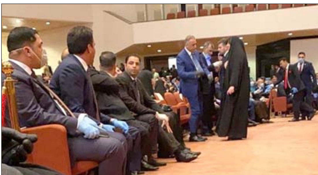
الكاظمي في مجلس النواب... أرشيف