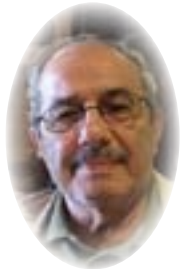
■ بقلم ساموئيل كاهر* ■ ترجمة عادل حبه

في أمريكا اللاتينية، لكن هذه الشركات عانت من انتكاسات، وفشلت في الفوز بالسلطة أو التمسك بها. ومع ذلك، يبدو أن التيارات الأيديولوجية التي يمثلونها، وهي تسعى بشكل أساسي إلى تشويه سمعة اليقين النيوليبرالي، قد حققت نوعاً من الهمزة الخلفية - الميول الاشتراكية بحكم الواقع (حتى لو كانت في الغالب لصالح الطبقة الغنية والمتوسطة) التي لا تجرؤ على التحدث باسمها.