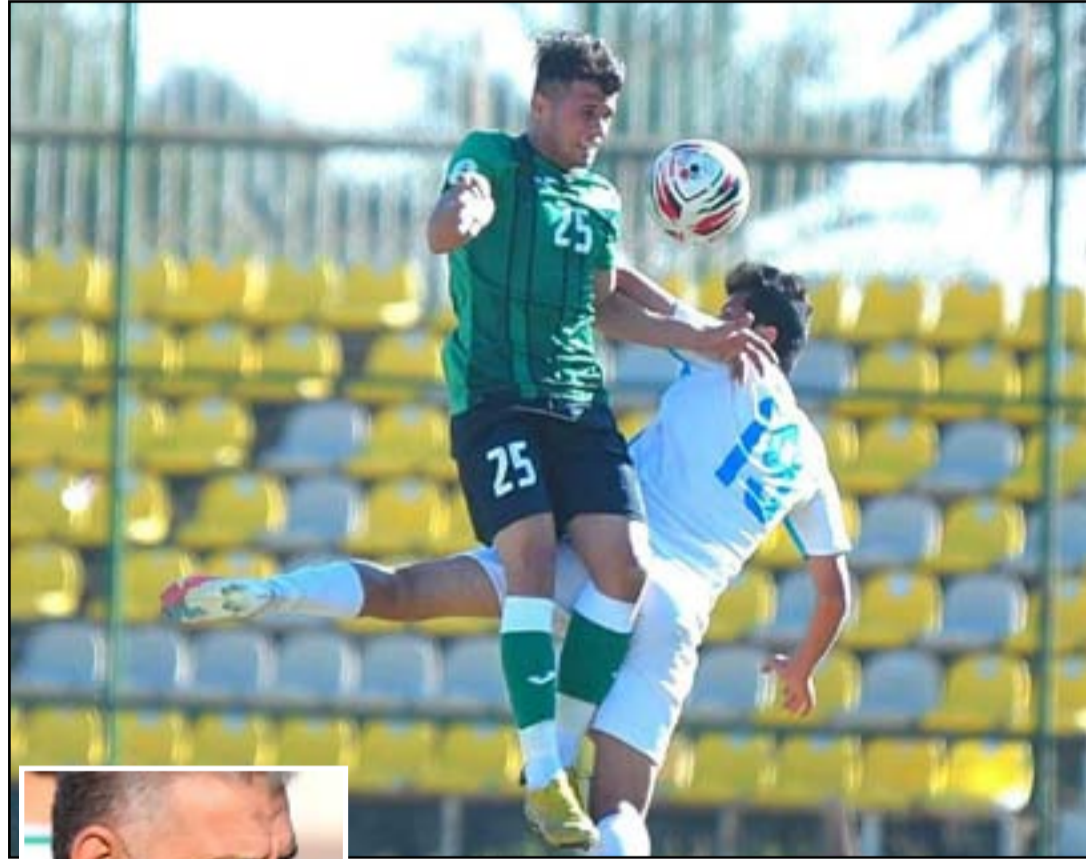
دوري كرة الممتاز بحاجة الى معالجات فنية

وأكثر، والطامة الكبرى إن أبناء بعض المديرين غير مرخّب بهم للانضمام في فرق الأندية حتى لو كانوا من أفضل لاعبي الفريق، وعند التحري عن السبب لا نجد غير الخسوف من فضج تلاعب الإدارة ومدرب الفريق بعقود اللاعبين.