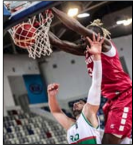
لقامان حاسمان سلة الوطني في تصفيات آسيا

كشفت الاتحاد الآسيوي لكرة السلة عن جدول منافسات النافذة الثالثة لحساب المجموعة الرابعة بتصفيات كأس آسيا 2021 التي تصفيها قاعة مدينة حمد المغلقة للاعبين الرياضية العاصمة البحرينية المنامة خلال الفترة من التاسع عشر ولغاية الثالث والعشرين من شهر شباط المقبل بمشاركة منتخبات لبنان والعراق والهند والبحرين البلد المنظم وفق إجراءات احترازية صحية ووقائية للحفاظ على سلامة الجميع بموجب