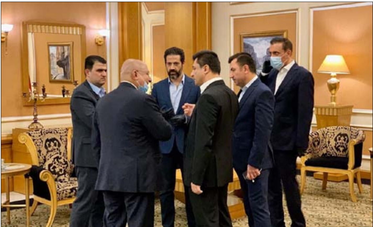
الوفد الكردي في زيارة سابقة لبغداد

يشار الى ان مشروع قانون الموازنة المالية العامة لعام 2021 الذي وصل إلى مجلس النواب، بعد التصويت عليه من قبل مجلس الوزراء، تمت قرأته قراءة أولى وثانية تحسنت قبة البرلمان، وسط مناقشات وآراء متضاربة من أعضاء البرلمان حول عدة فقرات تخص القانون، ومنهم من طالب بإرجاع الموازنة الى حكومة مصطفى الكاظمي، لأجل اجراء تعديلات عليها لاسيما ما يتعلق بخفض الانفاق، في حين ترى أطراف أخرى ان ارجاع الموازنة الى الحكومة سيستغرق وقتاً طويلاً، وبالتالي فالوضع العام في البلاد لا يتحمل تأخيراً أكثر مما يجري.