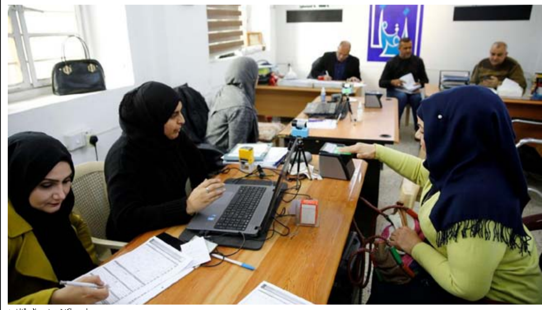
لحد مراكز تحديث سجلات الناخبين

الدعم المطلوب، وبالاخص تحديث سجل الناخبين، فان الكرة الان هي في ملعب البرلمان والكتل السياسية بقدر ما يتعلق الامر باجراءاتهم المتعلقة بالانتخابات المبكرة، أي انه يتوجب عليهم اكتمال القانون المتعلق بالمحكمة الاتحادية وهي الجهة المسؤولة عن المصادقة على نتائج الانتخابات، وكذلك التصويت على حل البرلمان وهو