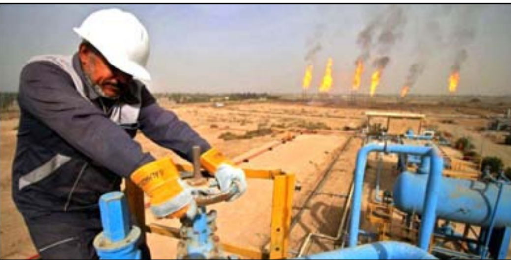
حقل نفطي جنوب العراق ... ارشيف

الكاتب والخبير الاقتصادي الدكتور صادق البهادلي، يقول، إن الغاية من اقتراض العراق من البنك الدولي هو سد العجز المالي في الموازنة العامة للدولة، لاسيما وأن قروض وتمويل البنك الدولي بفوائد قد لا تتجاوز ١.٥٪ ولأجل