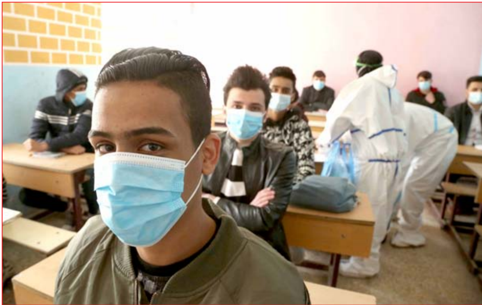
فرق صحية جواله في احد المدارس لكشف المصابين بكورونا

يتحدث نواب كرد عن ثلاثة خيارات لحسم الخلاف على الملف النفطي لموازنة العام الحالي،