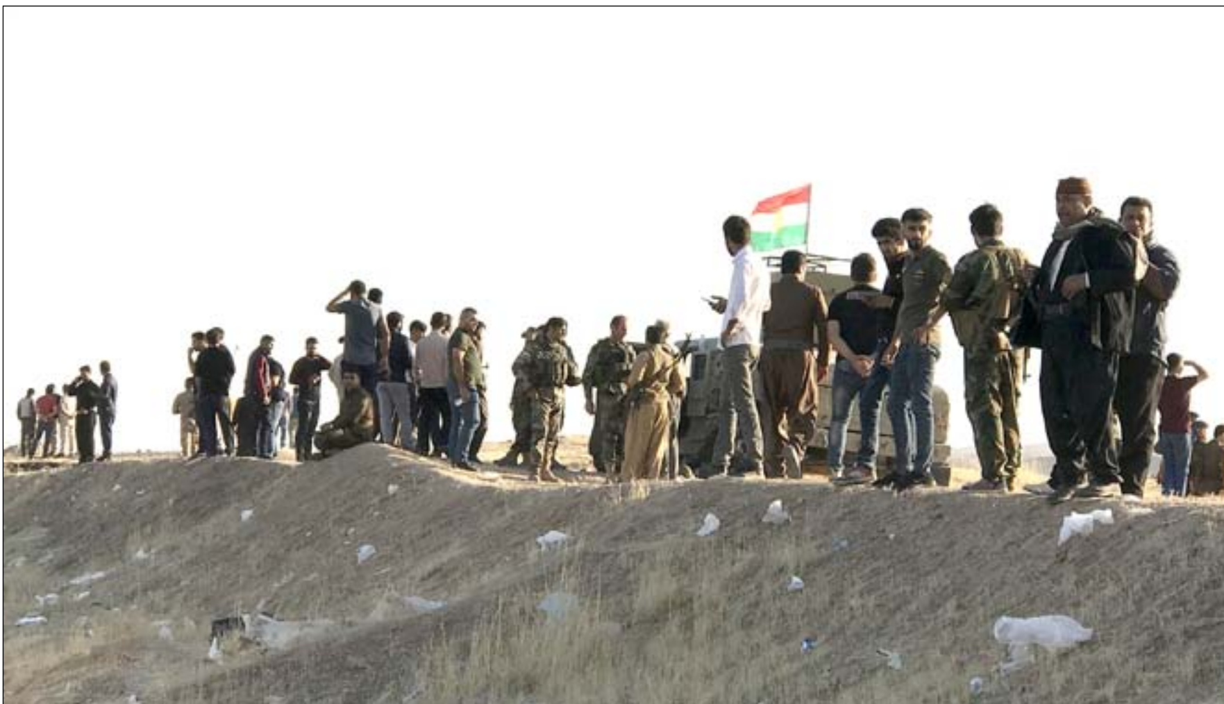
قوة من البيشمركة في محافظة دهوك

يوما بعد آخر يزيد حزب العمال الكردستاني (pkk) رصيده من العنف ومسؤوليته عن تهجير السكان في شمالي الموصل و كردستان، فيما لا تبدو اي جهة عراقية ترغب بمقاتلته سوى تركيا. وامس تسبب الحزب المعارض لانقرة بمقتل واصابة ١١ عسكريا من "البيشمركة" بينهم ضباط في هجوم اختلفت حواله الروايات في محافظة دهوك.