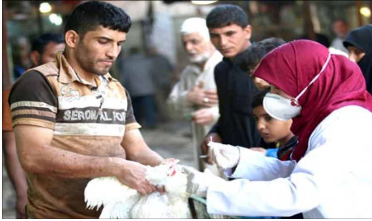
فريق طبي أثناء فحص الدواجن

ارتفع عدد الإصابات بأنفلونزا الطيور في محافظة البصرة خلال الساعة الماضية، إذ تجاوزت حد الأربعة آلاف إصابة في اليوم الواحد، وهو ما يندرج عن كارثة ومشكلة خطيرة تتطلب التدخل للسيطرة على هذا المرض قبل انتشاره ووصوله إلى المحافظات المجاورة. وسارعت الجهات المحلية في محافظة البصرة إلى إغلاق أكثر من ستين حقلاً لتربية الدواجن بعد تأكدتها من تسجيل إصابات لأكثر من (٤٥) ألف حالة، وبدأت بإعدام الدواجن المصابة مع منع نقل الدجاج الحي لأسواق المحافظة والإقصية والنواحي. ويؤكد نائس حبيب حمزة، مدير عام دائرة البيطرة العراقية في تصريح لـ (المدى) أن "محافظة البصرة سجلت إصابات متعددة بفايروس أنفلونزا الطيور خلال اليومين الماضيين في أحد حقول تربية الدواجن، مبيناً أن "الدخول غير قانوني (التهرب) للدجاج التركي إلى مدينة البصرة سبب عملية انتقال أنفلونزا الطيور لهذه الحقول".