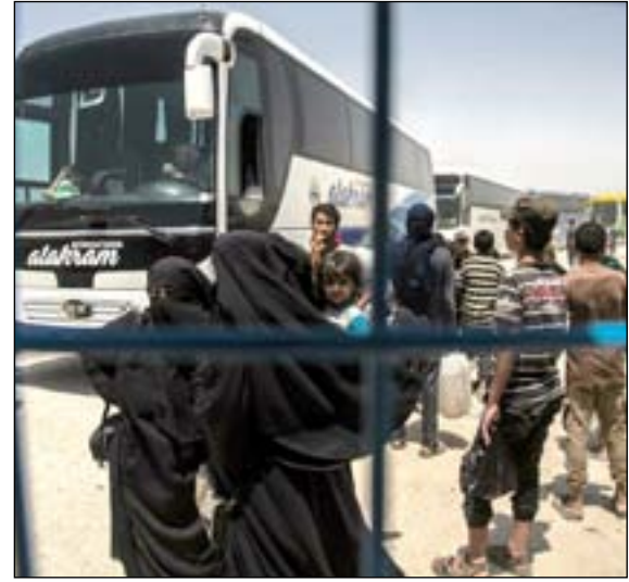
نازحون يغادرون مخيم الهول