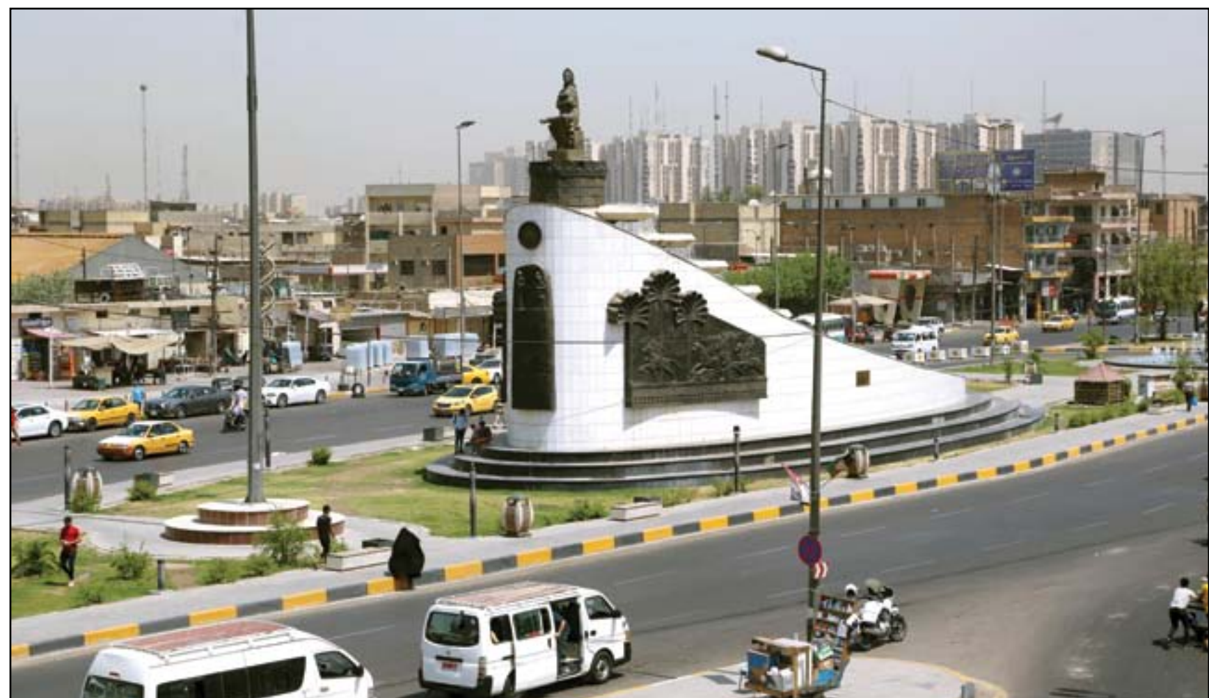
تمثال (فتاة بغداد) في مكانه الجديد بمنطقة العراوي وسط العاصمة.. عدا: محمود رؤوف

اليوم الاول للمظاهر السلمي كنا وما زلنا نسعى لوطن آمن ومدينة آمنة مستقرة تتحرك بها عجلة الاعمار بأيادي نظيفة بيضاء غير متحزبة في مدينة نبذت التحزب وقدمت الدماء الطاهرة في سبيل ذلك. واريدهم اقسماً منذ استشهادهم وطالبوا الحكومتين المحلية والاتحادية بتوفير الخدمات وتفعيل ملف محافظتهم المنكوبة. الى ذلك عزاً محافظ ذي قار اسباب تأخر افتتاح المستشفى التركي والجسر الكونكريتي الى ما تشهده المحافظة من اضطرابات. وجاء في بيان المتظاهرين الذي تلى في ميدان الجبوبي بحضور مئات المتظاهرين وتابعتة (المدى) انه "منذ