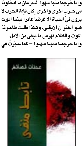
مع الراحل رشدي العامل