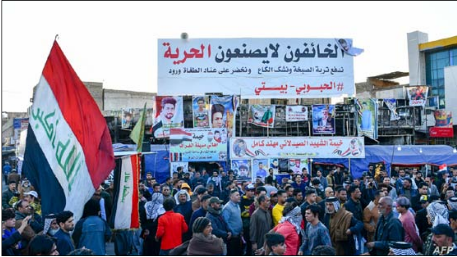
محتجون في ساحة الحويبي وسط الناصرية

وكانت تسريبات قد اشارت الى فقدان اثر ٦ عوائل من الـ ١٠٠ التي وصلت الى مخيم الجدة الذي يضم ٢٣٠٠ عائلة، نسبة عوائل التنظيم منهم تصل الى ٩٥٪.