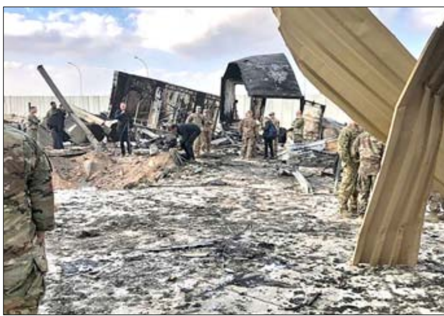
قصف يستهدف قاعدة عين الأسد

ترجمة / حامد احمد الولايات المتحدة تحاول جهد امكانها تفادي تهديد متسارع من فصائل مسلحة في العراق بعد قيامها باستخدام أسلحة أكثر تطورا في استهداف مواقع أميركية من بينها طائرات مسيرة تحمل أسلحة ضربت أكثر الأماكن سرية وحساسة ولم تتمكن منها أنظمة الدفاع الجوي. استنادا لمسؤولين أميركان فانه في ثلاث هجمات على الأمل وقعت خلال الشهرين الماضيين استخدمت الفصائل المسلحة فيها طائرات مسيرة صغيرة تحمل قنابل وضربت أهدافها في هجمات ليلية على قواعد عراقية بضمتها مواقع تستخدم من قبل وكالة المخابرات المركزية CIA ووحدات العمليات الخاصة الأميركية. ايران، التي اضعفتها سنوات من العقوبات الاقتصادية القاسية، تستعين بفصائل مسلحة مدعومة من قبلها في العراق لزيادة الضغط على الولايات المتحدة لتخفيف تلك العقوبات كجزء من احياء اتفاق ٢٠١٥ النووي. مسؤولون عراقيون وأميركان يقولون بان إيران صممت هجمات الطائرات المسيرة لتجسيم نطاق الخسائر الذي قد ينجم عنه رد عسكري أميركي. مايكل مولروي، ضابط سابق في وكالة المخابرات المركزية ومسؤول كبير لدى البنتاغون لشؤون الشرق الأوسط، قال انه مع التكنولوجيا الموفرة من قبل قوات فيلق القدس الإيرانية، فان الطائرات المسيرة هذه أصبحت أكثر تطورا وكلف واظنة نسبيا. ومضى بقوله: "الطائرات المسيرة مشكلة كبيرة، وهي من بين أخطر التهديدات التي تواجهها قواتنا هناك". مسؤول رفيع في الامن الوطني