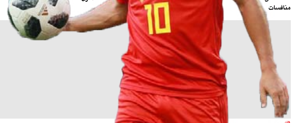
المنتخب البلجيكي في بطولة يورو 2020

وقال مارك ديغريس، في تصريحات لنقلتها صحيفة "أس الإسبانية": "أن الجيل الحالي سيقدّم أداء أكثر من رائع في بطولة الأمم الأوروبية 2020". وتحدث عن رأيه في إيدين هازارد مع المنتخب، قائلاً: "لا يمكن أن نأمل في أداء أفضل من هازارد، لأنه لم يلعب خمس مباريات جيدة متتالية في عامين". وسُئِلَ بأن البعض يعتقد أن هازارد، سيأخذ مخاوفه من ريال مدريد، فردّ قائلاً: "بطبيعة معرفتي بهازارد، لن يفعل ذلك، الشيء الرئيسي الآن هو أنه يحافظ على لياقته البدنية". وأضاف: "أعتقد أن وجود هازارد ضمن منتخب بلجيكا، بالإضافة إلى المباريات الودية، سيساعده كثيراً على تقديم مستوى أفضل، ويمنحه التواجد في المنزل".