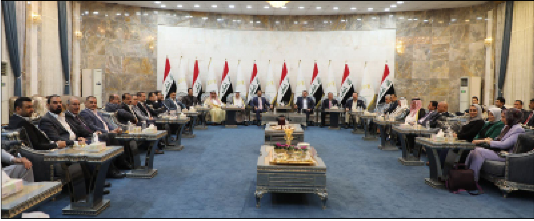
تحالف السيادة مصر على تنفيذ ورقة مطالبه في مقدمتها اقرار العفو العام

ومنذ تحرير الجرف في 2014، كانت أكثر التبريرات لعدم إعادة السكان هو الخوف من رجوع الإرهاب ويجب الحصول على موافقة المحافظات المحيطة بالبلدة.