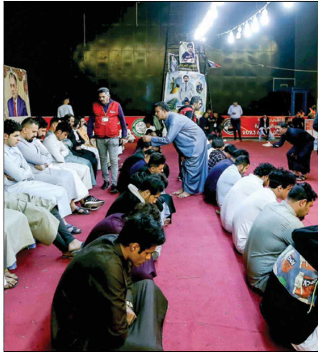
لعبة (المحيس) أبرز مظاهر شهر رمضان المبارك.. عدسة: محمود رؤوف