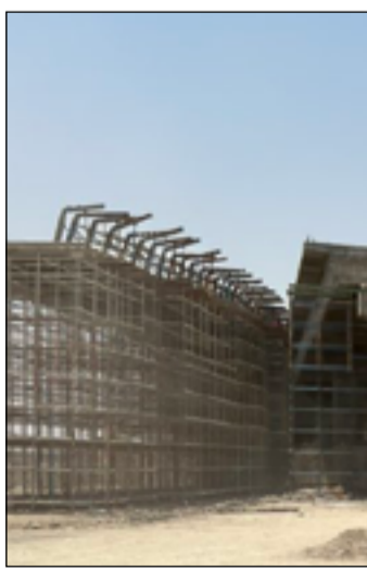
مشروع جسر الاسكان الصناعي في ذي قار

وفي بيان لاحق، تحدث محافظ ذي قار محمد الغزني، عن "أحالة وتوقيع عقود خمسة مشاريع خدمية في قضاء الغراف تضمنت انشاء مجمع ماء وخطوط ناقلة وشبكات ماء لتغذية قرى البوعيد (٥ جسور) ويطول كلي ٣٤٨ مترا مع انشاء قناطر صندوقية عدد ٢ في ناحية الطار وتوسعة وتاهيل جسر الغراف وتاهيل جسر سيارات حديدي داخل قضاء النصر وتاهيل جسر الفجر الرئيسي