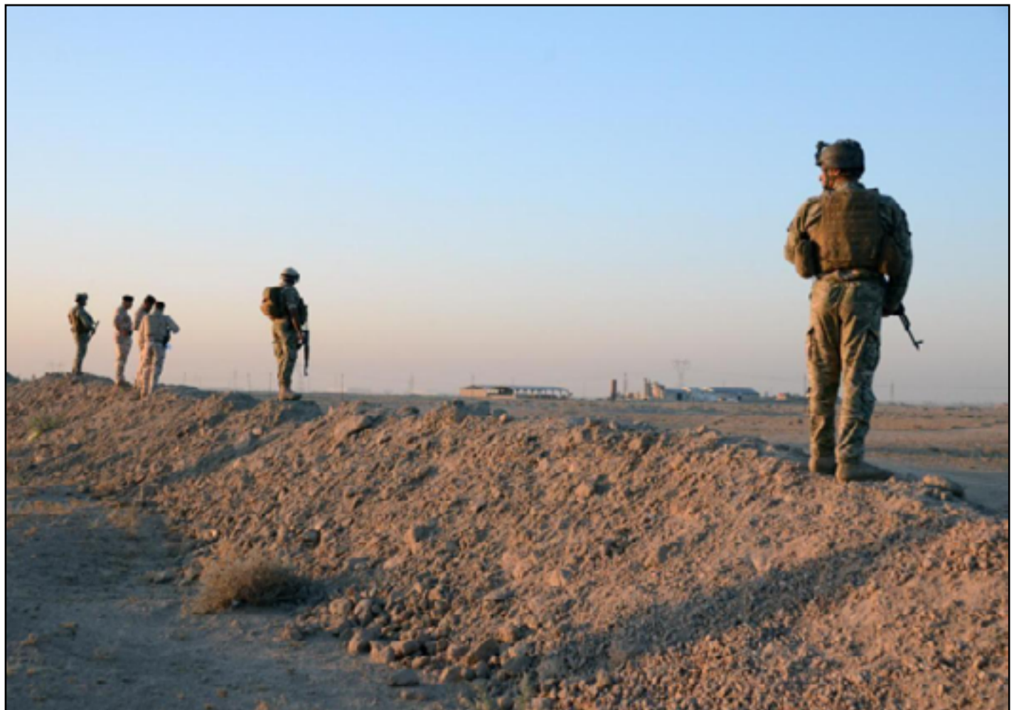
عناصر من حرس الحدود يقفون قرب الشريط الفاصل بين الاراضي العراقية والسورية

وأكد الخفاجي، «وجود مراقبة مستمرة واستطلاع متواصل للحدود السورية»، منوها إلى أن «هذه الاجراءات اثبتت توقف تسلسل الارهابيين عبر تلك المناطق».