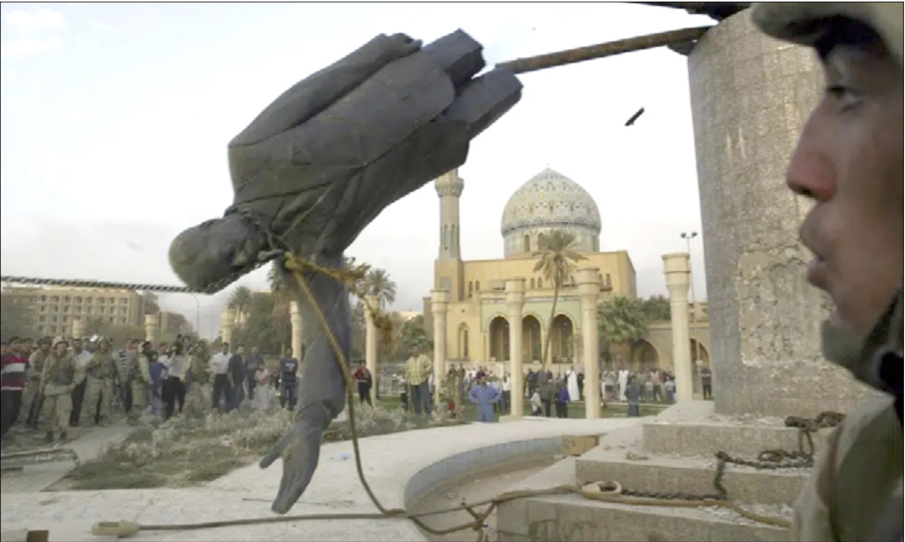
اسقاط تمثال صدام في ساحة الفردوس يوم التاسع من نيسان ٢٠٠٣

فيما يقول عبد السلام ٣٥ عاماً من مدينة الموصل، إن "أجد لا ينكر إن النظام السابق كان نظاماً دكتاتورياً". وأضاف عبد السلام، أن "ما حصل بعد ذلك هو ان اشخاصا حكموا البلد وفق نظام طائفي مبني على المحاصصة وتفشى بعد ذلك الفساد وسرقة المال