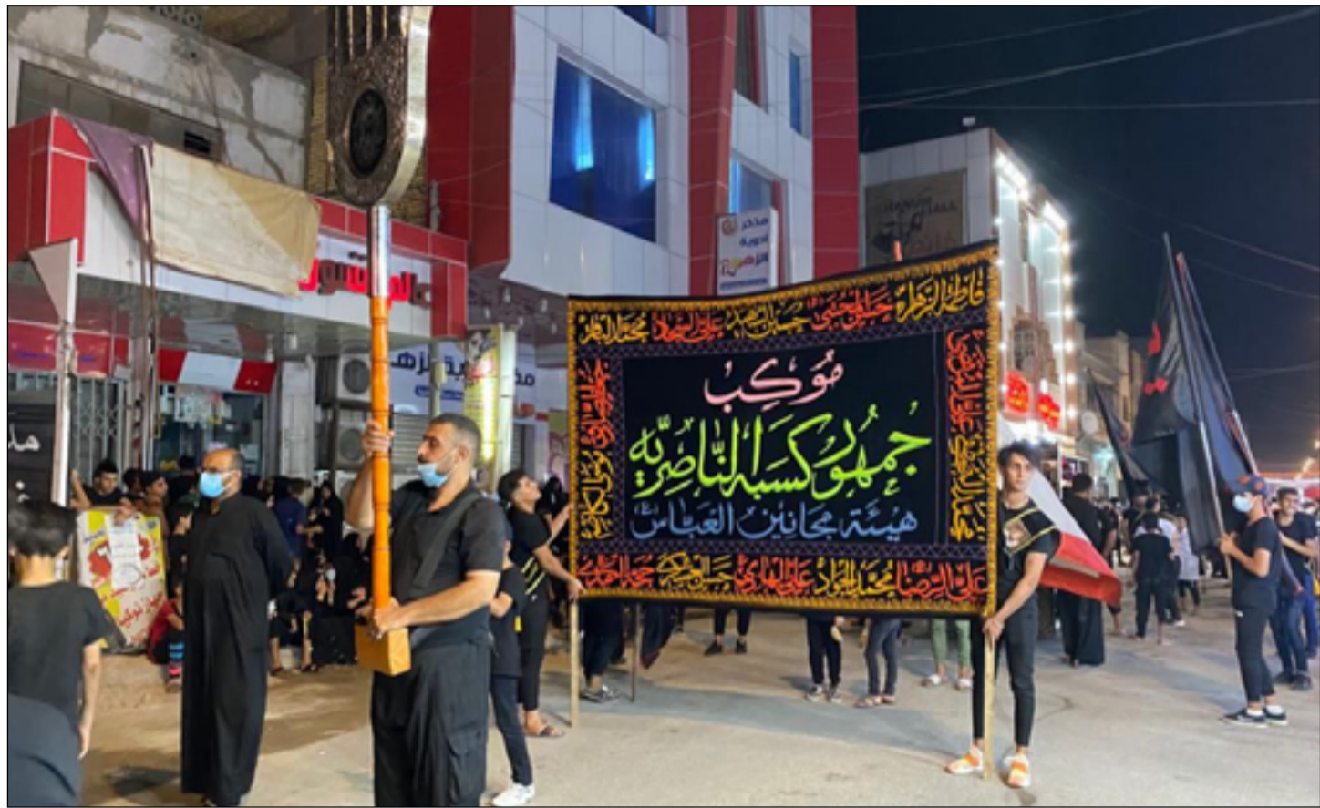
موكب حسيني لاهائي الناصرية

وتحدث الخالدي عن نشر سيارات اسعاف ضمن مراكز الإسعاف الفوري بواقع ٥٤ سيارة تعمل على مدار ٢٤ ساعة فضلاً عن سيارات الإسعاف في المستشفيات والمراكز الصحية التي ستكون جاهزة لأي حالة طارئة". وأشار، إلى أن "الخطة تضمنت استنفار اقسام طوارئ المستشفيات والمراكز الصحية الرئيسية والأطباء الاختصاص والكوارث الصحية والتجهيزات الطبية والأدوية فضلاً عن تشكيل فرق صحية لتقديم التوجيهات والإرشادات الصحية للزائرين". وأكد الخالدي، أن "الخطة الطبية شملت كذلك تهيئة رصيد كافي من قناني الدم في المستشفيات والمصارف الفرعية للتوجيهات الطارئة وتنفيذ حملات تبرع بالدم لزيادة الرصيد الاستراتيجي للمؤسسات الصحية". وفي غضون ذلك كشفت مديرية ماء ذي قار عن انطلاق حملة بعنوان (ساقى عطاشي كربلاء) لتأمين الخدمات والمياه