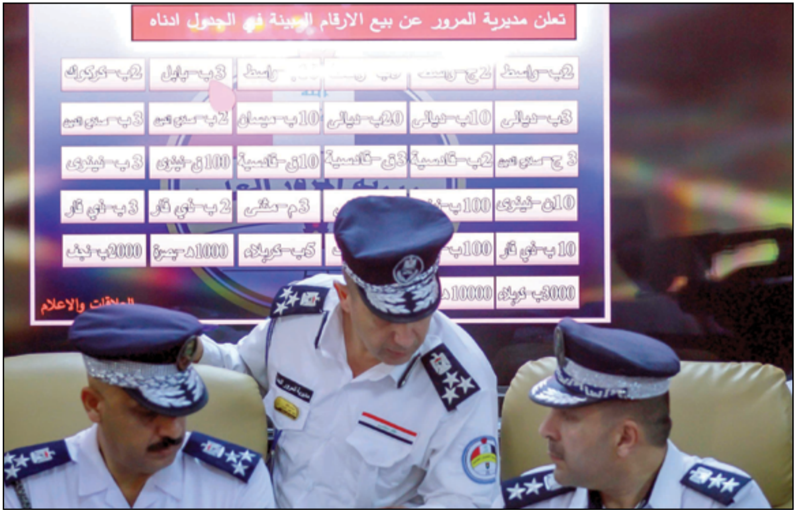
مزاود مديرية المرور لبيع الارقام المميزة للسيارات..

بعد مرور تسع سنوات لم يحصل هناك أي تغيير فيما يتعلق بإعادة الأعمار أو العثور على المفقودين من الضحايا. فما ما يزال الإيزيديون مقيدين في مخيمات النزوح يعانون من حرارة شمس الصيف اللاهبة والبرد القارس في الشتاء، انهم مشردون في بلدتهم. الإيزيدي، سيلو، يقول في لقاء مع محطة