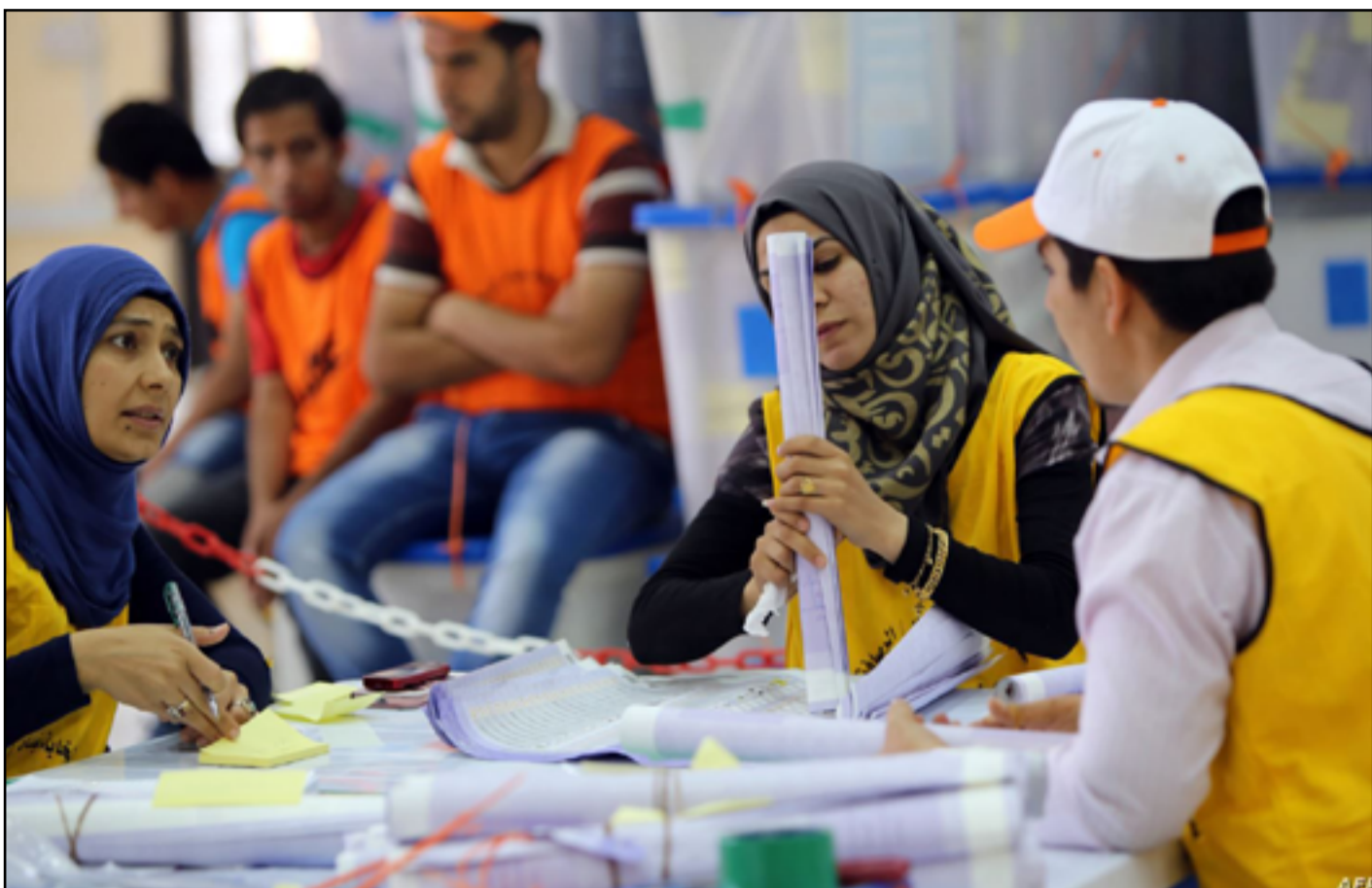
مفوضية الانتخابات تقرر تمديداً جديداً في استقبال قوائم المرشحين