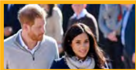
كايت. ويرجح أن تلازم ماركل لـ "صن" إنه لا علم لديه بأنه المنزل مع طفلها. وقال ترامب لن يقابل ماركل، متوقفاً أنها

وصف الرئيس الأميركي دونالد ترامب دوقة ساكس، الأميركية ميغان ماركل، بـ "المقرفة"، في مقابلة مع صحيفة "صن البريطانية". وقال ترامب: "لم أكن أعلم أنها مقرفة"، على خلفية تصريحات أدلت بها ماركل عام ٢٠١٦، حين هددت بالهجرة إلى كندا في حال فوزها بالرئاسة.