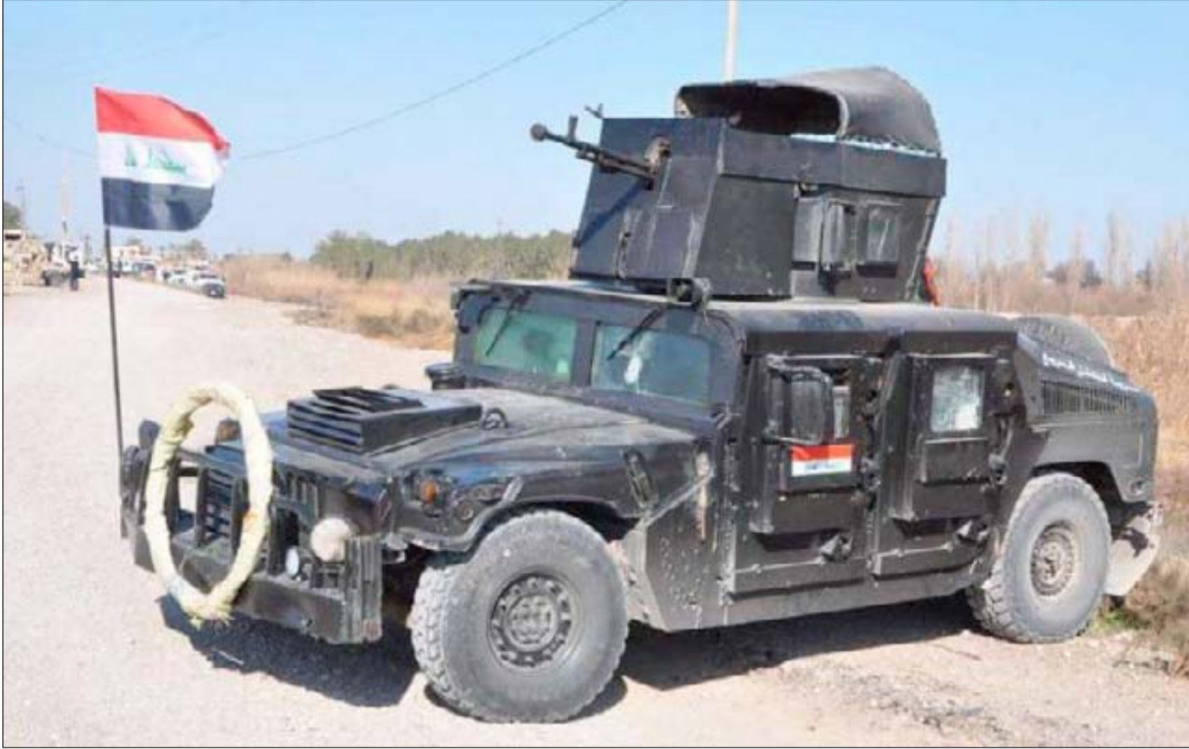
اللية عسكرية شمال بعقوبة.. أرشيف

ووفق ما يقوله المصدر فإن الجناة مروا أثناء دخولهم القرية عبر السيطرة الأمنية القريبة من مكان الحادث، وخرجوا من الطريق نفسه دون أن يعترضهم أحد. وبحسب شهود عيان، في الناحية، تحدثوا لـ (المدى) عبر الهاتف، أكدوا أن عدداً من سكان قرية أبو