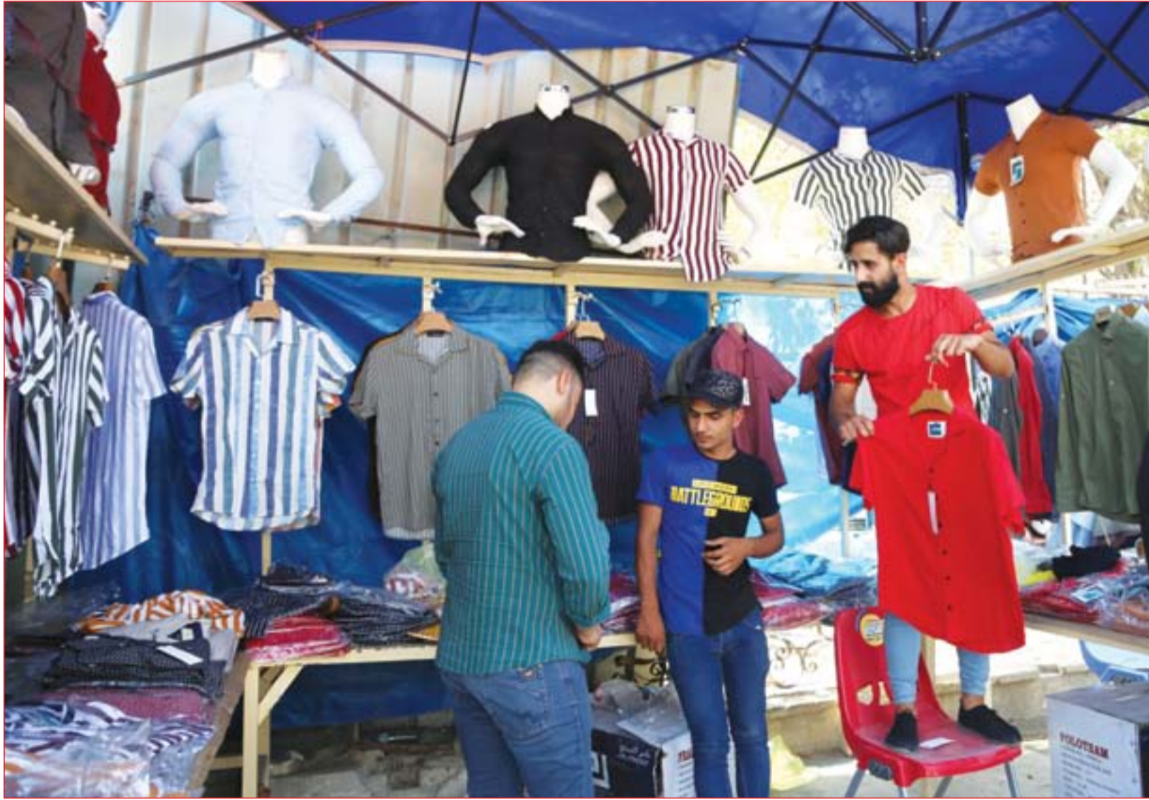
ازدياد الحركة التجارية في سوق الشورجة تزامناً مع العيد ..... عسة: محمود رؤوف