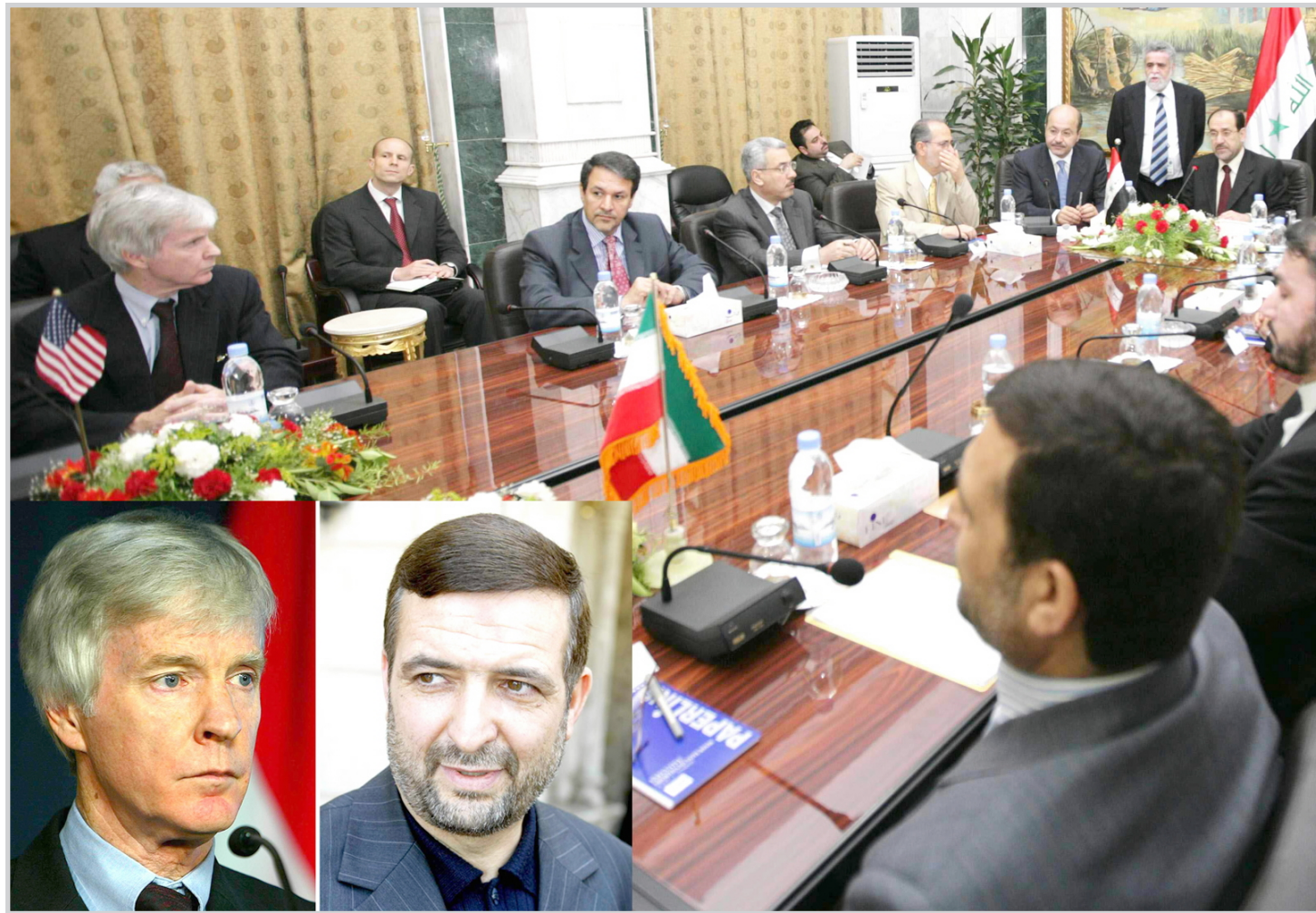
جانب من الاجتماع الأول الذي جمع قمي بكروكر في بغداد