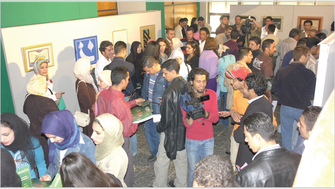
من نهارات المدى السابقة

تتعلق فعاليات نهار المدى السابع، يوم السبت القادم، بمشاركة عدد كبير من الفنانين الاطفال، والفنانين الذين يشرفون عليهم، وهم يقدمون فعاليات فنية متميزة، تعبر عن اعلامهم الصغيرة، في خضم هذا الوضع المضطرب، والمدك من جانبها فسحت لهؤلاء الصغار المجال، لتجسيد افكارهم ورواهم، من خلال احتضانهم، كما فعلت مع غيرهم من الذين ساهموا في النهارات السابقة. والتقينا هنا عدداً من المشاركين، تحدثوا عن طبيعة هذه المشاركة، وما تشكل لهم.