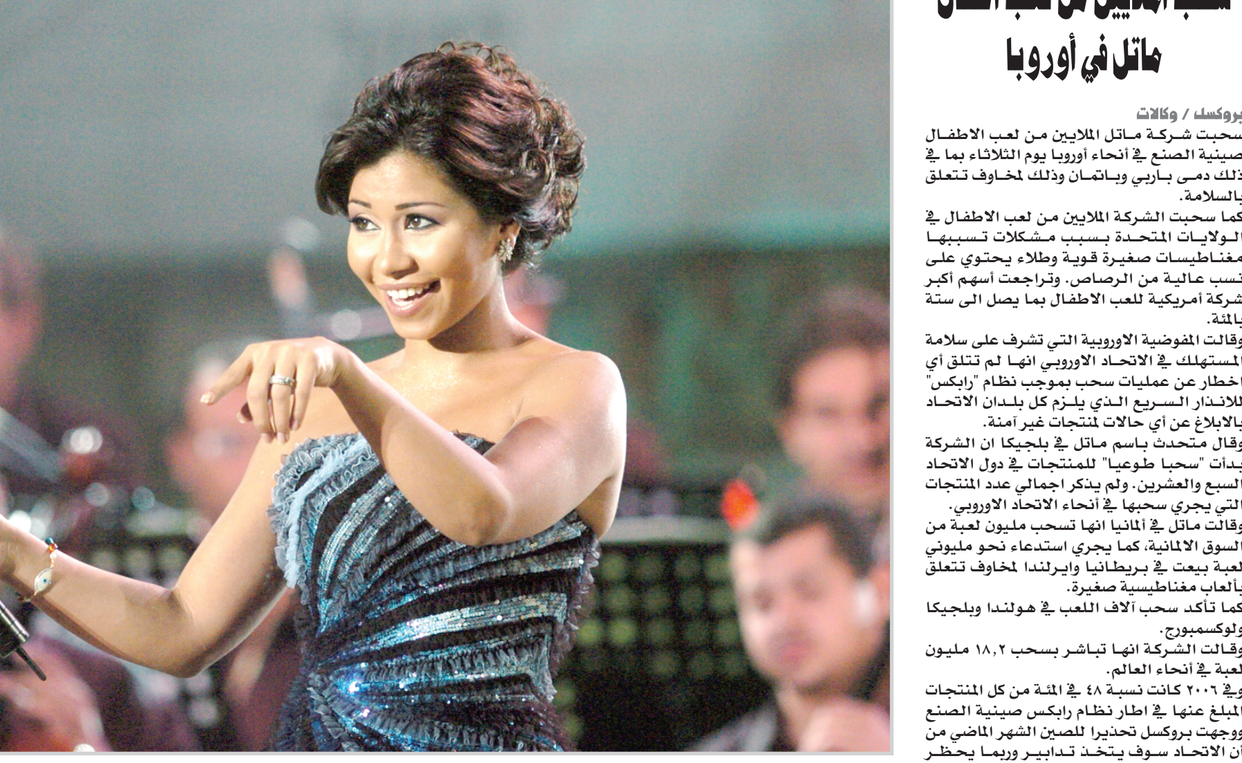
المطربة المصرية شيرين غفني على المسرح الروماني في مهرجان قرطاج المقام حالياً في تونس

سيدنيجا / اف هب امضى استرالي في ال ٥٣ اسبوعا على شجرة هربا من تماسيح جبانة في منطقة مليئة بالمستنقعات في استراليا حسب ما ذكرت الصحف الثلاثاء. وروي ديفيد جورج صاحب مزرعة في شبه جزيرة كايب يورك (شرق) اسبوعه العصيب الذي امضاه على شجرة ليبقى حيا. وقال جورج لاحدى الصحف الاسترالية "كل ليلة كان يحرق تمساحان في ويكثان تحت الشجرة التي لجأت اليها". وبدأت تجربته الصعبة عندما سقط عن صهوة حصانه ثم عاد ليتمطيه محاولا ايجاد الطريق ليعود الى منزله. لكن الحصان تاه وحمله الى منطقة مليئة بالمستنقعات والتماسيح. واضاف "لم يكن في وسعي العودة الى السوراء لان الوضع كان خطيرا وبالتالي توجهت الى الشجرة التي كانت اول موقع مرتفع لانقاذ حياتي". وبعد مرور ايام ابلغت اسرته اجهزة الشرطة باختفائه واطلقت على الفور عمليات بحث جوا وبراً. وتابع جورج انه كان يحاول لفت الانتباه بالتلويح بقميصه.