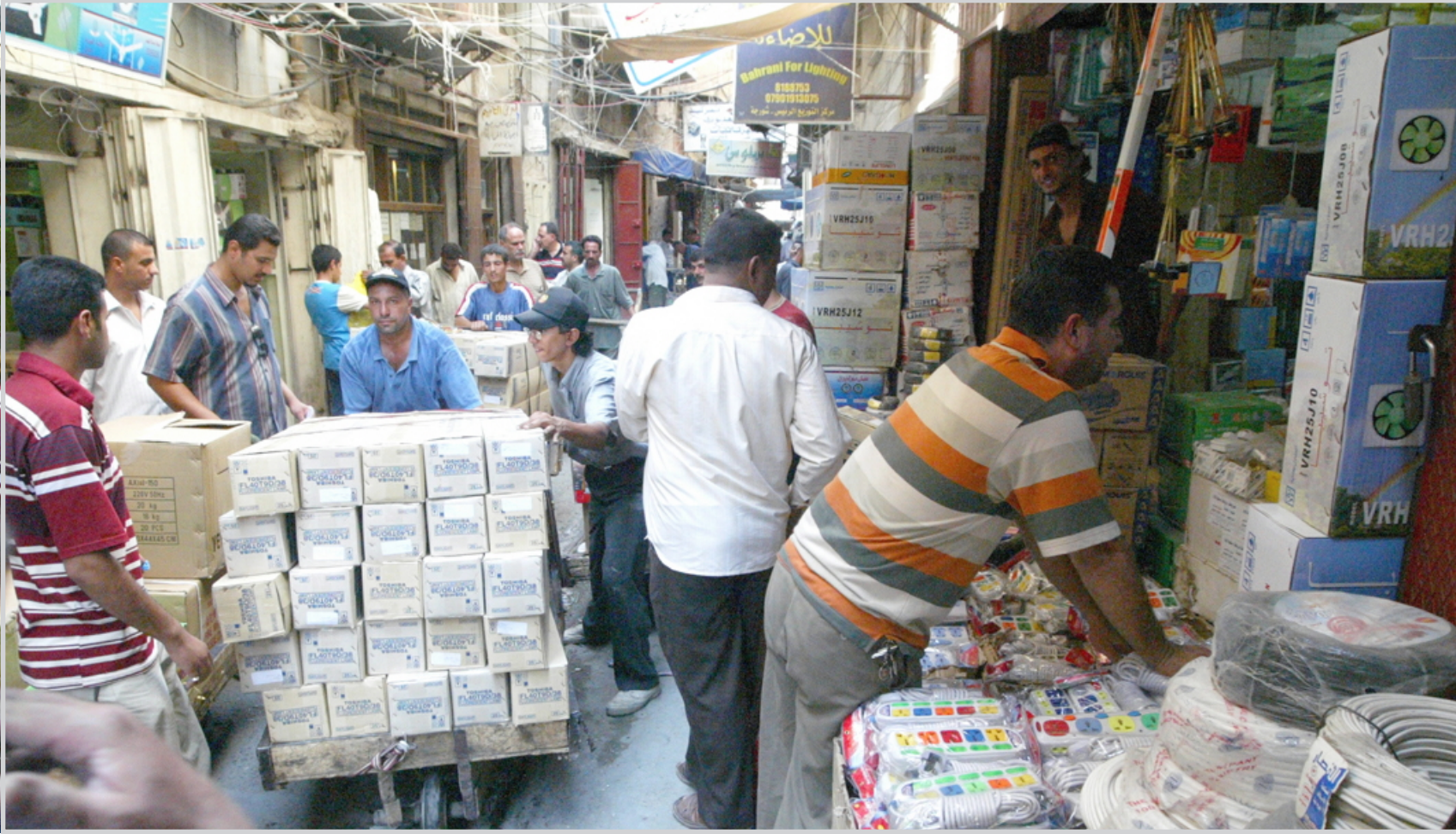
استسواق عمال من بغداد .. بغداد امس

بغداد / المدعا بحث وزير المالية باقر جبر الزبيدي مع الجانب الصيني إعادة البنى التحتية وتجديد وتطوير وإعادة تأهيل المشاريع الاستراتيجية في العراق مستندين على ما تمتلكه الشركات الصينية من خبرة وامكانيات واسعة في تنفيذ مثل هذه المشاريع. جاء ذلك خلال لقائه السفير الصيني في العراق جين الكسيدونك. وأشاد وزير المالية بالحكومة الصينية ودورها في تخفيض ديون العراق. وجرى بحث توريد أجهزة كشف الحاويات في المنافذ الحدودية وضرورة إيصالها بأقرب وقت ممكن وتم الاتفاق على قيام الهيئة العامة للكمارك بمتابعة الموضوع بجدية ووفق الاجراءات والضوابط القانونية. وأكد الوزير على موضوع تنفيذ ماتبقى من الديون العراقية والبالغة ٢٠٪ على مدى ٢٣ سنة من ضمنها خمس سنوات معفاة من الدفع وضرورة تحويل مذكرة التفاهم بين الدولتين الى اتفاقية دائمة.