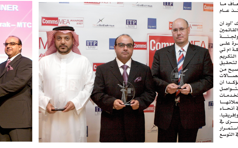
الجدير بالذكر ان مجموعة إم تي سي وسعت مؤخرًا من انتشارها، ففوزها منتصف هذا العام بالبرخصة الثالثة لشبكة الهاتف النقال في المملكة العربية السعودية، ما يعطي الشركة فرصة دخول اضعف سوق المنطقة، كما يتبع السوق الجغرافي الإستراتيجي للمجموعة فرصة الاستفادة من تجار شبكتها في منطقة الشرق الأوسط.