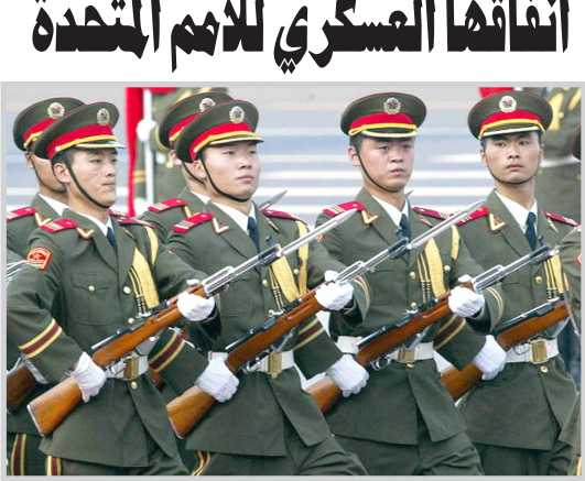
بكين / CNN

ردا على الانتقادات اليابانية لها بشأن "شفافية" الإنفاق العسكري، قررت الصين أنها ستستخدم خطوط حول ذلك، وأنها سترفع تقارير بحجم الإنفاق على الشؤون العسكرية إلى الأمم المتحدة، وستتابع إبلاغها أولا بأول حول مبيعات الأسلحة. وقالت المتحدة باسم وزارة الخارجية الصينية، جيانغ يو، إن بكين تقدم للأمين العام للأمم المتحدة "بيانات أساسية حول إنفاقها العسكري في السنة المالية الأخيرة". وأضافت يو: "تعد هذه خطوة مهمة من جانب الصين نحو تعزيز مستوى الشفافية العسكرية". وكانت الصين قد توقفت عن تقديم بيانات ومعلومات للسجل الدولي لعاهدة الأسلحة، الذي يبين صادرات وواردات سبع فئات من الأسلحة المشمولة بالعاهدة، منذ عام ١٩٩٦، وذلك بعد "أن قدمت دولة معينة معلومات مفصلة عن مبيعاتها من الأسلحة إلى تايوان". وسوف تستأنف الصين تقديم معلومات وبيانات حول صفقات الأسلحة التي عقدها بعد أن توقفت "تلك الدولة" عن تقديم مثل هذه المعلومات إلى تايوان، وفقاً لما ذكرته جيانغ يو.