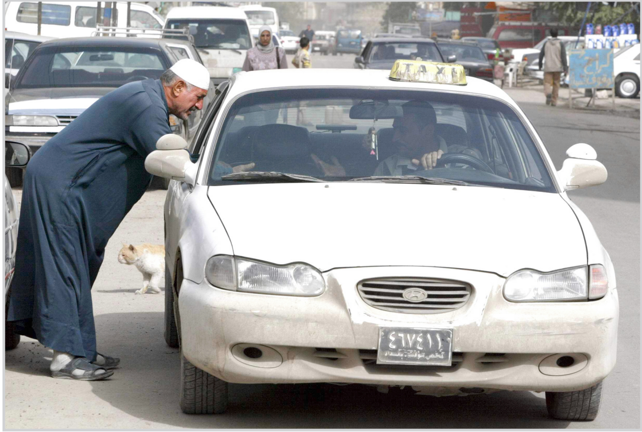
بغداد / حسين ثقب

مشادة كلامية حدثت بين سائق إحدى سيارات نقل الركاب المتوسطة (كيا) مع مواطن عرفت فيما بعد انه موظف في إحدى الدوائر الحكومية سببها ارتفع في اجرة النقل عن اليوم الذي سبقه بمقدار (٢٥٠) ديناراً. حوادث كهذه تتكرر يوميا حيث شهدت اسعار النقل الداخلي خلال الفترة الماضية ارتفاعا كبيرا مختلف الخطوط العاملة داخل العاصمة بغداد. والتي اخذت تؤثر سلبا الامكانيات المادية للعائلة العراقية التي دخلها محدود ولا تستطيع مقاومة ذلك الارتفاع المتواصل. ما جعل المواطن لا يستطيع وضع ميزانية مادية لعائلته وكذلك لانتقاله من العمل الى المنزل وبالعكس هذه المشكلة صارت تأخذ حيزا كبيرا من تفكير شريحة واسعة من المجتمع في اثناء حياته اليومية.