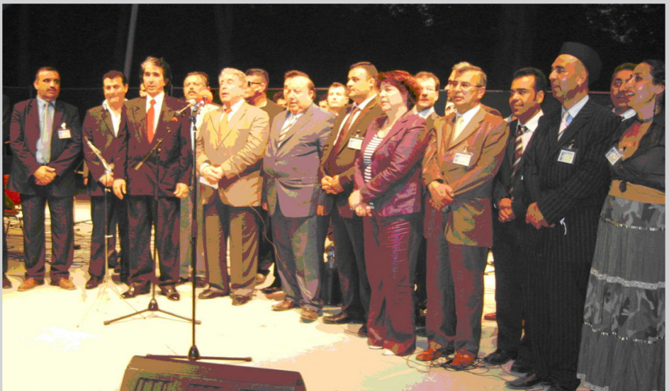
من نشاطات الرابطة

نشط المثقفون العراقيون منذ هجرتهم الأولى في نهاية السبعينيات وتحديدا سنة ١٩٧٨ عندما غادروا الوطن مكرهين رابطة المثقفين الديموقراطيين في بيروت وتتابع تشكيلاتهم التنظيمية في إيطاليا وهولندا وفي بلدان المهجر وكانت ولادة رابطة بابل للكتاب والفنانين في المهجر الهولندي واحدة من أبرز محاولات المبدع العراقي في المجال التنظيمي فقد قامت الرابطة لا في احياء أنشطة فردية لمبدعين عراقيين في مجالات متنوعة واسعة كما في التشكيل والموسيقا والغناء