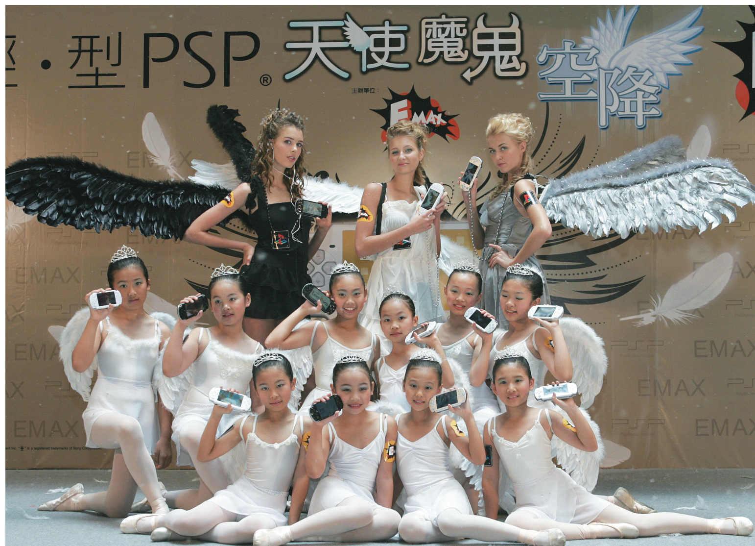
مجموعة من راقصي وراقصات الباليه في هونغ كونغ تروج لجيل جديد من ال (بلاي ستيشن) والذي اطلق بيعه امس