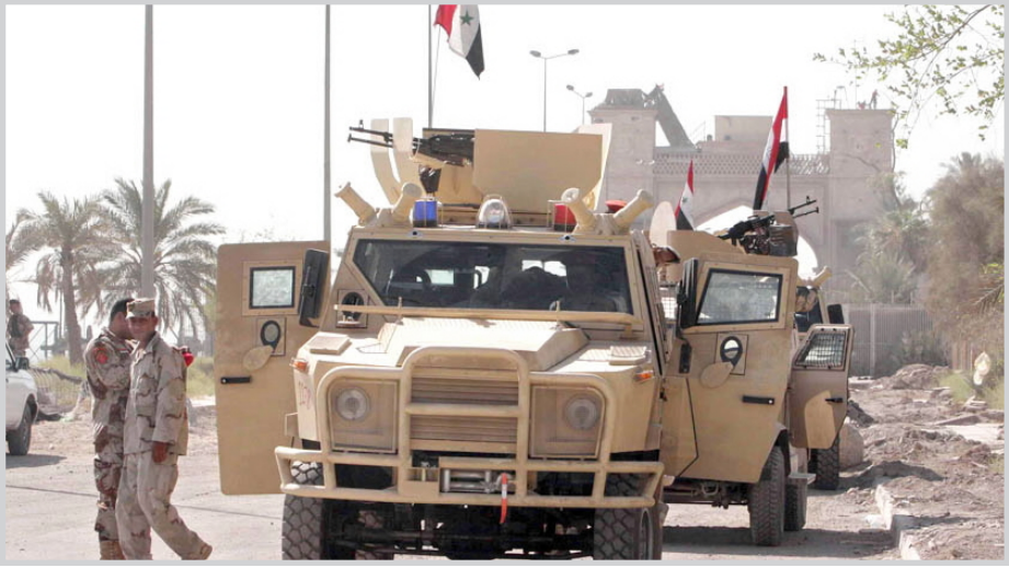
اتقاء تسلم القوات العراقية لاحد القصور الرئاسية في البصرة

التي تمت الموافقة عليها من قبل الأئتلاف وتم تطويرها بتعاون الحكومة المحلية". وأضاف أن "تسليم القصور أصبح ممكنا بسبب التقدم الذي أنجز، والقابلية التي اظهرتها القوات العراقية وخاصة الجيش". "موضحا " بما ان العراقيين يتولون المسؤولية المتزايدة عن الأمن في البصرة، فلا نحتاج القصور الرئاسية". وأشار القنصل البريطاني الى أن القوات المتعددة الجنسية كانت