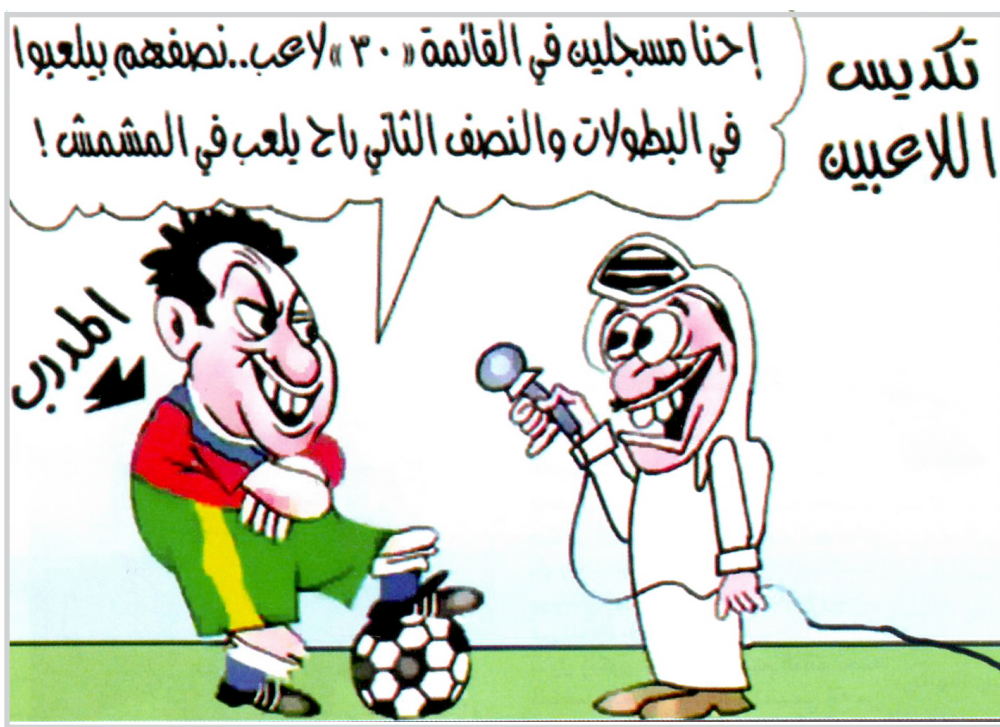
عبدن (تج) يوم الملاعب

التي تعاقد معها النادي هي اولى بايثبات اهليتها في الدفاع عن عرين الانيق سواء في بطولة العرب او مسابقة الدوري الممتاز لانهم الاقرب من الملوك للتدريب والاكثر انسجاما وولاء ووفاء من اخرين يقومون باداء واجب النخوة ويمضون صوب انديتهم.