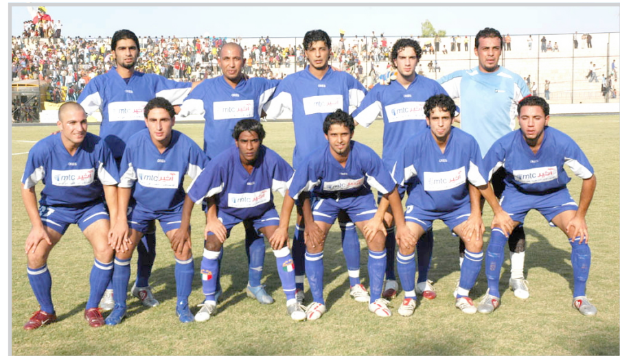
المناصر الشبابية في الطلبة جديرة بحمل المسؤولية

يقص فريق الطلبة شريط مشاركة الكرة العراقية في النسخة الخامسة من دوري أبطال العرب يوم الاثنين المقبل عندما يواجه فريق اتحاد العاصمة الجزائري في العاصمة السورية دمشق في إطار الجولة الأولى من منافسات البطولة.