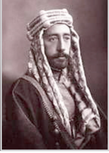
الملك فيصل الاول