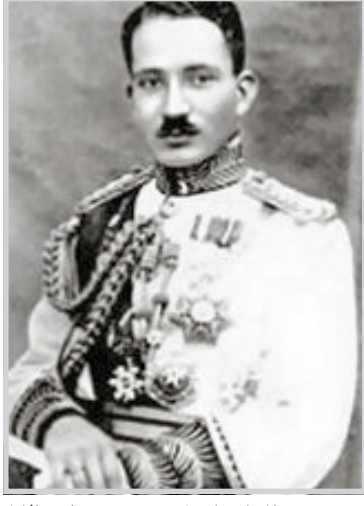
الملك غازي الاول

الاردن وعندما نصب الامير فيصل ملكا على العراق ونوقشت مواد القانون الاساسي في المجلس التأسيسي وبموجبها غدا الامير غازي وليا للعهد على عرش العراق وعندما وصلت اسرة الملك فيصل الاول العسراق تمت الاستعدادات الرسمية لاستقبال الامير غازي وكان سرور الملك فيصل الاول بالغا لرؤية ولده غازي الذي لم يره منذ امد بعيد وفي الحال شرع الملك يهتم بولده غازي فاستعان بالمربي العربي الكبير (ساطع الحصري) مدير المعارف العام يومذاك وبثه همومه ومخاوفه على ابنه الوحيد وولي عهده في حكم المملكة فقال له: