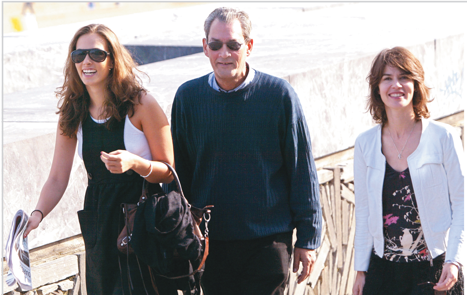
المخرج يول اوستر مع ابنته صوفيا والمثلة إيرين جاكوب قبل عرض فلمهم(الحياة الداخلية لمارتن فروست) في مهرجان سان سباستيان امس

كوبنهاغن/وكالات ضبطت الشرطة الدنماركية كاسي شراب على شكل قرنين مطلين بالذهب في وقت متأخر يوم الثلاثاء في أعقاب سرقة جزء من التراث الوطني للبلاد من متحف في مدينة جيلنج عاصمة الفايكنج في جوتلاند. وقالت الشرطة انها ألقت القبض على أربعة أشخاص بينهم امرأتان بعد تلقيها معلومات سرية وضبطت الكاسين وبعض الأشياء المسروقة الأخرى المصنوعة يدويا. وأضافت أن أحد الأشياء في الاقل لايزال مفقودا.