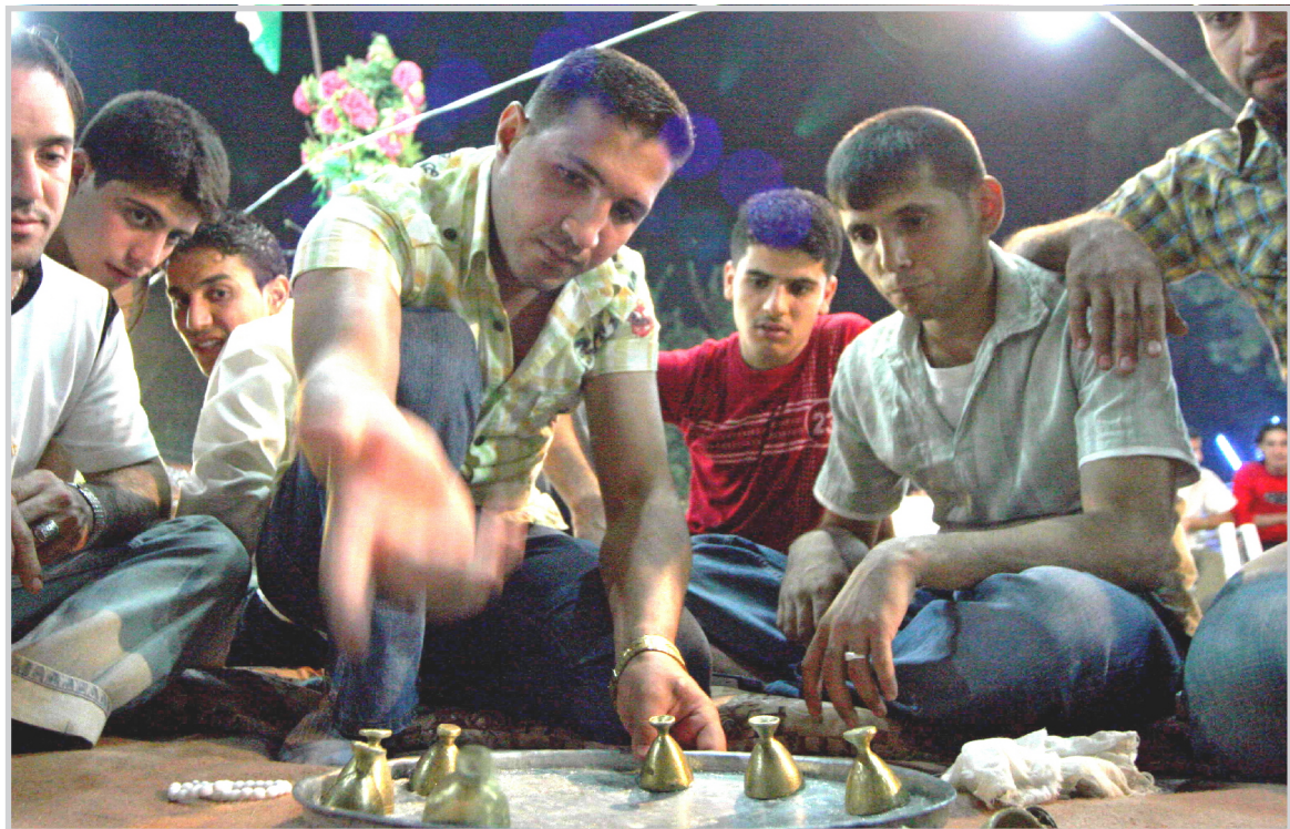
من العشاب رمضان في كردستان

المدينة لتتنافس على جوائز توزع على الفائزين في نهاية الشهر. ويقول مصطفى في هذه البطولة يشارك خمسون فريقا تمثل احياء المدينة وتستمر البطولة لغاية الخامس والعشرين من شهر رمضان حيث المباراة النهائية وتوزيع الجوائز على الفائزين". وبالإضافة الى لعبة الصبينة هناك ايضا مسابقات اخرى تجري في كل مساء مثل طرح الاسئلة على الحضور واعطاء الجوائز للفائزين لاضافة جو من المرح على هذه الامسيات.