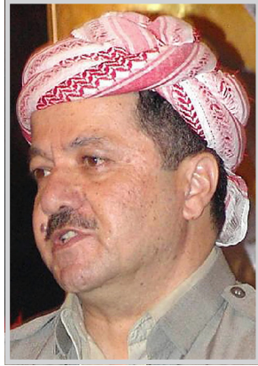
مسعود بارزاني استقبل رئيس اقليم كردستان مسعود بارزاني في مقر اقامته

بمصيف صلاح الدين وهذا فرنسيا برئاسة جان فرانسوا سفير فرنسا في العراق. في اللقاء سلم السفير الفرنسي رسالة من وزير الخارجية الفرنسي الى الرئيس مسعود بارزاني، أكد فيها على قرار وزارة الخارجية الفرنسية بضرورة افتتاح القنصلية الفرنسية في اربيل، ثم أكد الوفد الضيف على أن افتتاح القنصلية في اربيل سيعزز العلاقات بين فرنسا واقليم كردستان. وتباحث الجانبان في الأوضاع الأمنية في العراق، والاتفاقية التي تم توقيعها بين بعض الأحزاب السياسية، وتأثير تلك