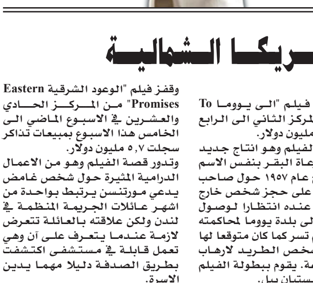
الفنان الراحل مارسيل مارسو في أحد أدواره

أسس شركته الخاصة عام ١٩٤٨ وسرعان ما انطلق بجول بفرقته البلدان الأوروبية الأخرى، ويقدم مسرحياته الصامتة. لكن شركته أفلست عام ١٩٥٩، واحتفظ بها وحولها إلى مدرسة فنية عام ١٩٨٤. ترك مارسيل مارسو خلفه عشرات الأفلام، ومن أفضل أعماله " فيلم صامت" الذي أخرجه الأميركي ميل بروكس.