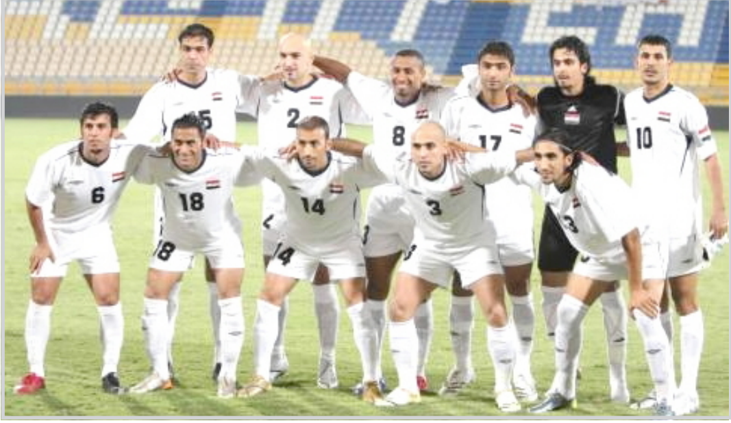
الحاصدة العراقية اقتلعت حقل الزر الباكستاني

الاهور؟" وغيرها من التعليقات التي دلت على اهتمام الاعلام النرويجي وتغطيته الدقيقة باسهاب لكل مراحل اعداد المنتخب. فيما محطه (L.C) القائلة (الفوز العراقي اقتلعت حقل الزر الباكستاني بسبعة اهداف مرسومة). ومن الناحية الفنية اقتتعت (المدى) اصحاب الشأن والاختصاص وقد دونت الردود وسجلت ابرز الملاحظات الفنية على المستوى الفني للفريق العراقي. كويستو: انطلاقات الاجانب ضرورية التحاضر الدولي وصاحب نظريات التدريب في معهد ايسلوف في السويد كريستر هنا الشعب العراقي على الفوز الالامع وقال "انا كرجل كاديمي ومتخصص لا يهمني ان كان الفريق الباكستاني قويا ام لا انما اهتم بالجانب التحليلي الفني لكره القدم، فمنتخبكم قدم في مباراة امس الاول افضل تطبيق للأساليب الهجومية المتمثلة باللعب في العمق والانتشار الامثل في الفراغ واللعب العريض تارة شمالا وتارة يميناً واتباع المسافات الصحيحة بين خطي الوسط والهجوم". واضاف " شاهدت المدرب اولسن قد اهتم بالبناء البسيط في اعداد الهجوم وحرص على التغيير في المركز لعدد من اللاعبين وان ادرك جيدا ان الخصم كان ضعيفاً لكنها