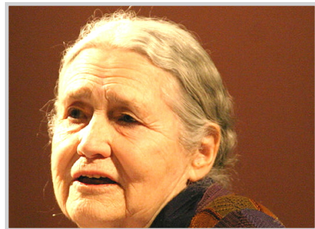
مؤيد / وكالات صدمت الروائية البريطانية دوريس ليسينغ الفائزة بجائزة

واستطردت الأدبية التي تبلغ من العمر ٨٧ عاما، وهي الأكبر سنا من بين الحاصلين على جائزة نوبل للاداب، "هل تعرف ما يتسناه الناس؟ هو أن الجيش الجمهوري الإيرلندي هاجم بقنابل حكومتنا،