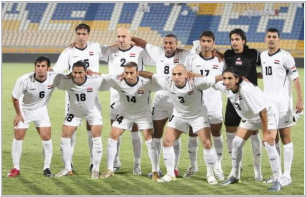
بطل آسيا قادم اسوء عروضه في الونسة الاخيرة