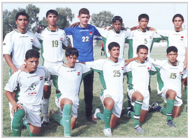
منتخبنا للناشئين يتطلع لعبور المنتخب الهندي