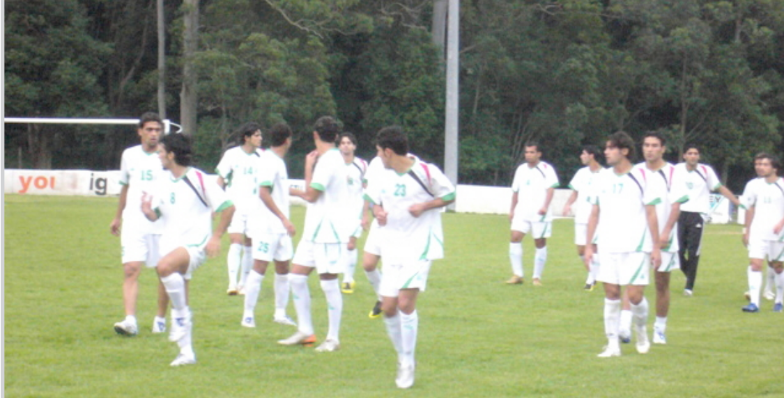
لاعبونا ادوا الوحدة التدريبية باطمئنان كبير على جاهزيتهم

من جهته أكد المدير الفني للمنتخب الأولمبي يحيى علوان على اصابة ارحيمية بالتأكد تشكل فراغا للاعب مقبتر ومتمكن فضلا عن كونه قائد المنتخب لكن الامر سيدفع برملائه لتعويض غيابه وبذل جهد مضاعف لتحقيق الفوز مشيراً الى ان بدائل قد اتخذت نتيجة هذه الاصابة الطارئة وأشار علوان الى ان جميع الاستعدادات للمباراة تم الانتهاء منها والمنتخب اصبح جاهزاً مناسبة لخوض المباراة والخروج منها بفوز لافت