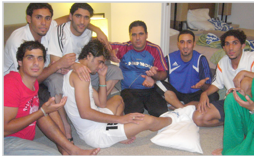
إرحيمية اسير اصابته وسط مجموعة من زملائه

نظيفين لكنه اهدر فوزاً ثميناً بتعادله ١-١ سلباً امام كوريا الشمالية في الجولة الرابعة. والجدير ذكره ان منتخبنا الأولمبي القصري المنتخب الاسترالي من دور الثمانية في الاسيوية الأولى التي يتصدرها منتخبنا برصيد ٤ نقاط وهو الرصيد ذاته لمنافسا المنتخب الاسترالي الذي تقدم عليه بفارق الأهداف فالمنتخب الاسترالي بحث عن فوز يضمن هذه الحركة الكروية المهمة. واكد علوان ان ما يتأكد جيداً من تحقيق الفوز وستنتزع ثلاث نقاط ثمينة لحسابنا ونفرد بالصدارة والاقتراب اكثر من الصن.