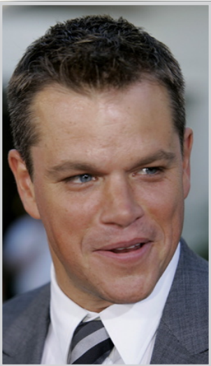
مسيرته الاحترافية هما "Syriana" الذي صور أجزاء منه في امارة دبي، وسلسلة أفلام "Ocean's" البوليسية.