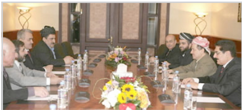
أربيل / الوكالات استقبال رئيس إقليم كردستان مسعود بارزاني، في مصيف صلاح الدين هاشم الحمداني ورئيس مجلس محافظة نينوى ودريد كشمولة محافظ نينوى وخسرور كوران نائب المحافظ. و تناول اللقاء الوضع الامني وكردستان في دعم ومساعدة