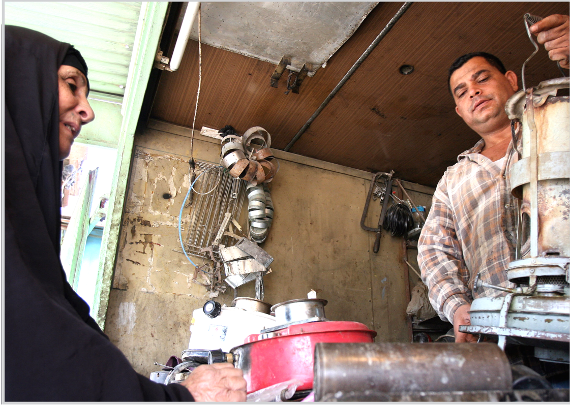
فصل دق ناقوس الخطر