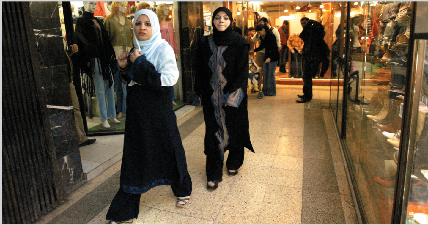
الخطوات النسائية تدب في شوارع بغداد.. من جديد

بغداد / الصدا صادق مجلس الرئاسة يوم امس على قانون الاستثمار الخاص بتصفية النفط الخام بعد اقراره في وقت سابق من قبل مجلس النواب الدستور.. ويهدف القانون الذي حصلت (المدى) على نسخة منه الى تشجيع القطاع الخاص على المشاركة في عملية التنميمة الاقتصادية في العراق والاسهام في بناء القاعدة الصناعية من خلال الدخول في نشاط تصفية النفط الخام، ونصت المادة ثانياً على ان للقطاع الخاص انشاء مصاف تكرير النفط الخام وامتلاك منشآتها وتشغيلها وادارتها وتسويق منتجاتها عدا امتلاكه الارض، فيما جاء في نص المادة ثالثاً ان تلتزم الشركة المستثمرة بتشغيل ملاكات عراقية بما لا يقل عن (٧٥٪) خمسة وسبعين من المئة من مجموع العاملين، بينما اشترطت المادة رابعاً من القانون على المصفاة ان تكون بمستوى تقني متقدم وان لا تزيد نسبة انتاج المشتقات النفطية الثقيلة فيها على ٢٠٪. وشمل القانون ثمانى عشرة مادة نصت الخامسة منها على قيام وزارة النفط بتجهيز المصافي ببنط خام بما يتناسب والطاقة التشغيلية لها بالاسعار العالية فيما نصت المادة السادسة على تجهيز المصفاة بالنفط الخام من الانابيب الناقلة له ومن اقرب نقطة مناسبة للمصفاة وتعرف بنقطة التسليم. وتنص المادة السابعة بأن تخضع منشآت القياس والسيطرة الى التفتيش والمعايير الدورية من طرف ثالث ذي اختصاص ترشحه الشركة المستثمرة ويقترن بموافقة وزارة النفط. وجاءت في الاسباب الموجبة للقانون انه تمشياً مع التحولات الاقتصادية الجديدة في العراق ويهدف زيادة الفرص الاستثمارية للقطاع الخاص العراقي والاجنبي وتوسيع قاعدة مشاركته في نشاط تصفية النفط الخام لزيادة طاقات الانتاج المحلية شرع هذا القانون. نص القانون ٣