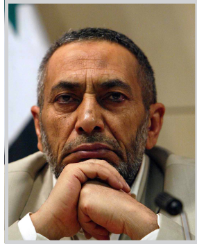
المحلية وفقا لبيان وزع قاعة البرلمان.

بغداد / الصدا واصل مجلس النواب خلال جلسة امس استكمال مناقشة قانون المساواة والعدالة وهو القانون البديل لاجتثاث البعث ورأس الجلسة الشيخ خالد العطية النائب الاول لرئيس المجلس بعد تعرض رئيس المجلس محمود المشهدي الى وعكة صحية نقل على اثرها الى مستشفى ابن سينا في المنطقة الخضراء حسب ما اكده مصدر مطلع في رئاسة الوزراء لم يكشف عن طبيعة الوعكة الصحية التي تعرض لها المشهدي الا انه قال ان رئيس المجلس غادر المستشفى بعد وقت قصير.