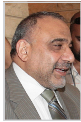
بغداد / الصدا

وتوفير الأمن والخدمات. اضافة الى ملف الديون العراقية والتأكيد على اهمية المشاريع والاستثمارات في مجالات الصناعة والزراعة وال عمران وتوفير الخدمات لمعم ابناء الشعب. من جانبه جدد كيمت دعم الولايات المتحدة الأمريكية للحكومة العراقية، ومساندتها في انجاح المشاريع التي تنعش الاقتصاد العراقي.