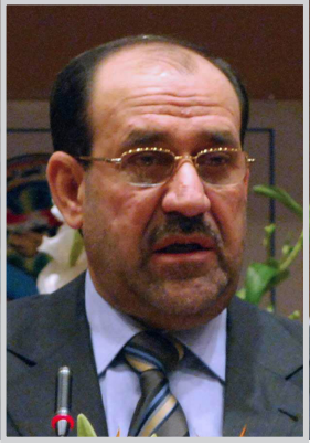
بغداد / الصدا

قرر رئيس الوزراء نوري كامل المالكي تكريم الوفد العراقي المشارك في دورة الألعاب الاولمبية الثانية عشرة لذوي الإحتياجات الخاصة التي اقيمت في مدينة شنغهاي في الصين. واعلنت الامانة العامة لمجلس الوزراء ان هذا التكريم الذي شمل (٣٥) شخصاً أتى بعد النتائج الباهرة التي حققها المنتخب العراقي خلال مشاركته في الدورة.