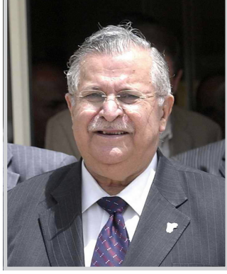
بغداد / الصدا

قرر رئيس الجمهورية جلال طالباني تخصيص راتب شهري لعائلة الفنان الراحل راسم الجميلي الذي وافته المنية في العاصمة السورية دمشق. وقد اقيم تشييع جنازة رمزية لتفقد الضن العراقي راسم الجميلي في مبنى المسرح الوطني، كما اقيم له مجلس عزاء في بغداد بمشاركة جمع غفير من الفنانين والمثقفين ومحبي الفقيد. واثناء المراسيم الرمزية اعلن مستشار رئيس الجمهورية جلال المشاطة ان الرئيس اوعز بتقديم الدعم المادي لاسرة الجميلي بعشرة الاف دولار اضافة الى راتب شهري سوف تتقاضاه اسرة الفقيد.