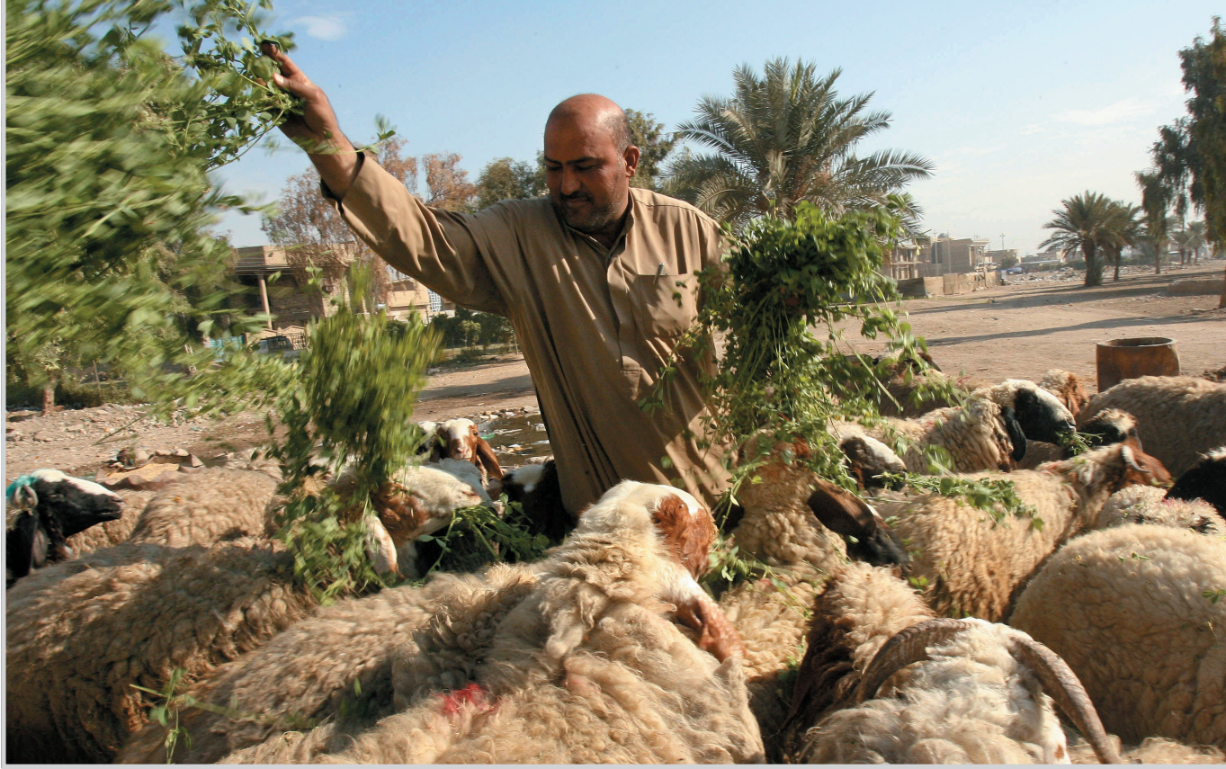
استعدادا لعيد الاضحى